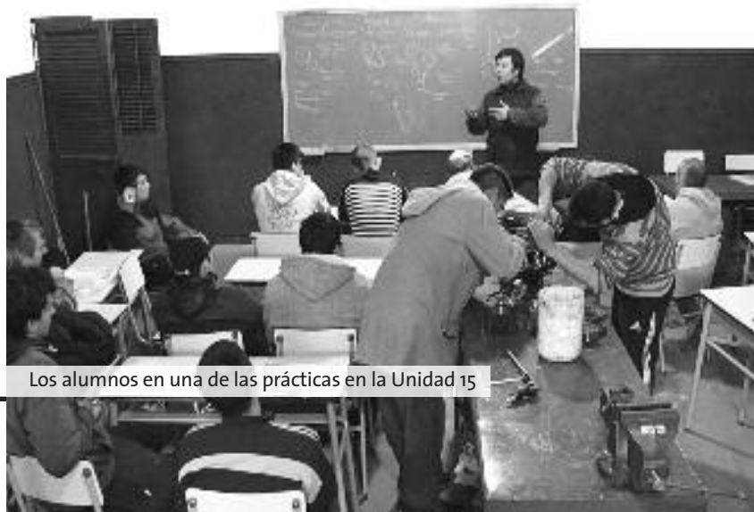
Los alumnos en una de las prácticas en la Unidad 15

Los egresados de los cursos se incorporarán a la base de datos del sector, a fin de facilitar su inserción laboral, teniendo en cuenta las empresas, talleres y PYMES del partido de General Pueyrredón de este rubro asociadas a SMATA, como así también a través de la Secretaría de Desarrollo Productivo se los incorporará a las bases de datos de la Oficina Municipal de Empleo.