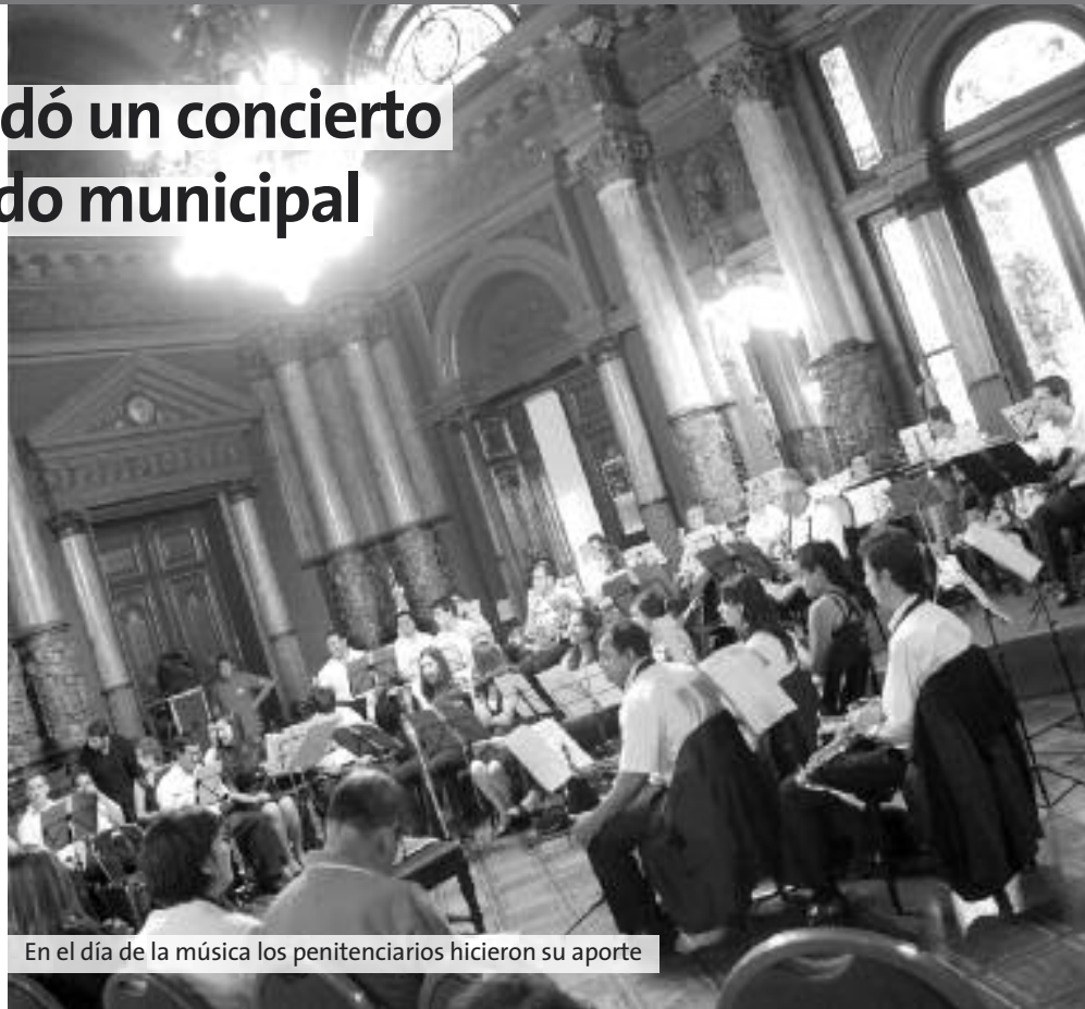
En el día de la música los penitenciarios hicieron su aporte

Luego de un breve intermedio hicieron "Sinatra in Concert", "Firulete" de Mariano Mores , "Libertango" de Astor Piazzolla y "Tico-tico" de Zequinha de Abreu . Los bises fueron "Desconfío de la Vida" del blusero Pappo Napolitano y se despidieron con "Galop" de Alfred Reed .