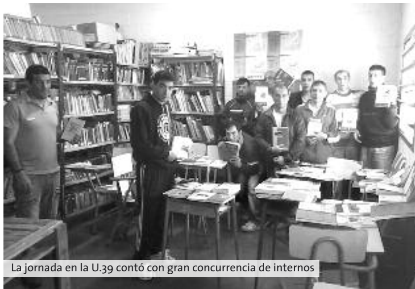
La jornada en la U.39 contó con gran concurrencia de internos

En Ituzaingó, la jornada comenzó con un interesante trabajo de los docentes sobre los 30 años de democracia. Luego,