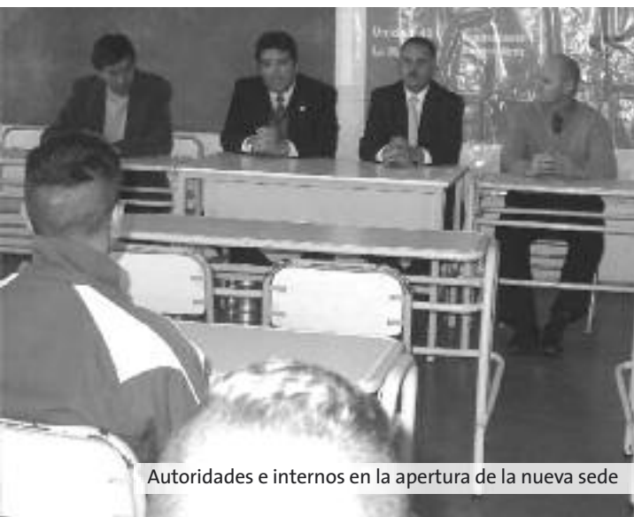
Autoridades e internos en la apertura de la nueva sede

En el marco del programa educativo que se desarrolla en los penales bonaerenses, se inauguró el 23 de septiembre una extensión de la escuela secundaria en el sector Casas por Cárceles de la Unidad 43 La Matanza, por lo que unos veinte privados de libertad allí alojados podrán cumplimentar un nuevo nivel de educación formal.