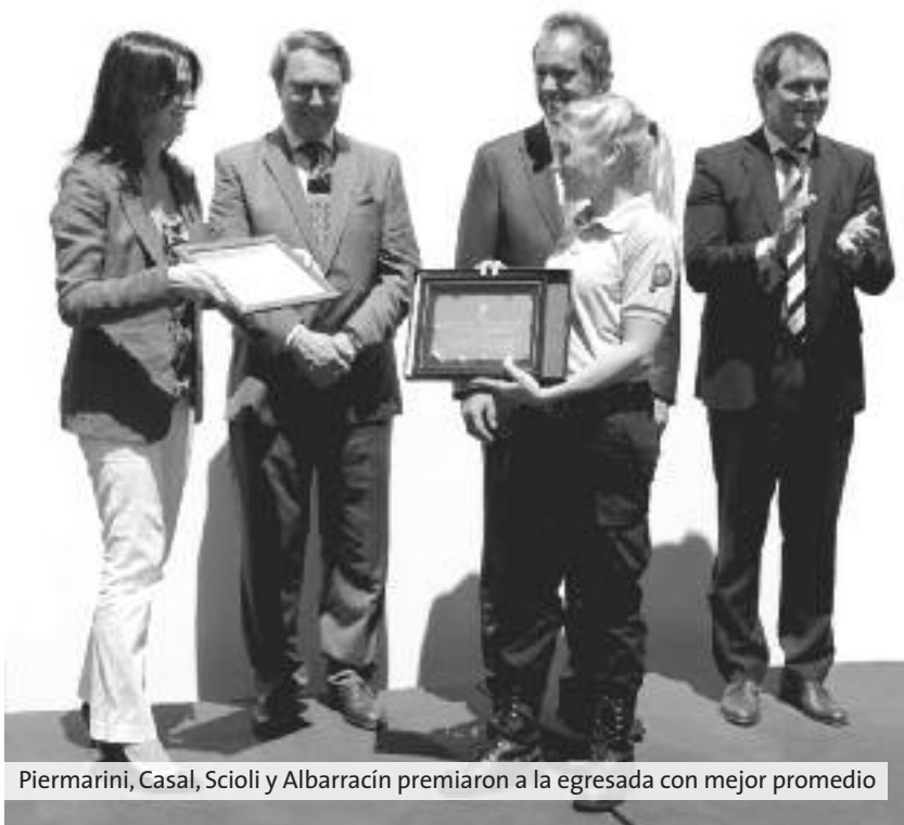
Piermarini, Casal, Scioli y Albarracín premiaron a la egresada con mejor promedio

Por último se entregaron los certificados de finalización y aprobación del curso de ingreso para guardias del escalafón general a los restantes 402 nuevos penitenciarios.