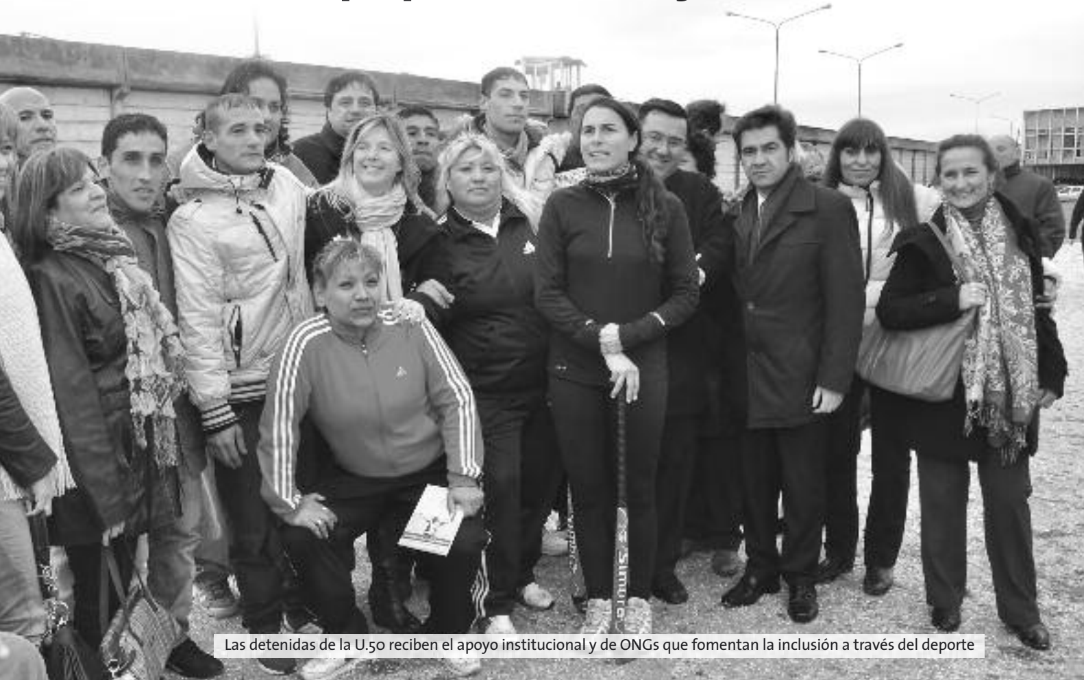
Las detenidas de la U.50 reciben el apoyo institucional y de ONGs que fomentan la inclusión a través del deporte

La ministra de Gobierno bonaerense y presidenta del Consejo Provincial de las Mujeres, Cristina Álvarez Rodríguez , encabezó el viernes 13 de septiembre pasado un evento de integración a través del deporte, en el marco del Foro Internacional sobre los Derechos de las Mujeres, el que se llevó a cabo en la Unidad 50 Batán.