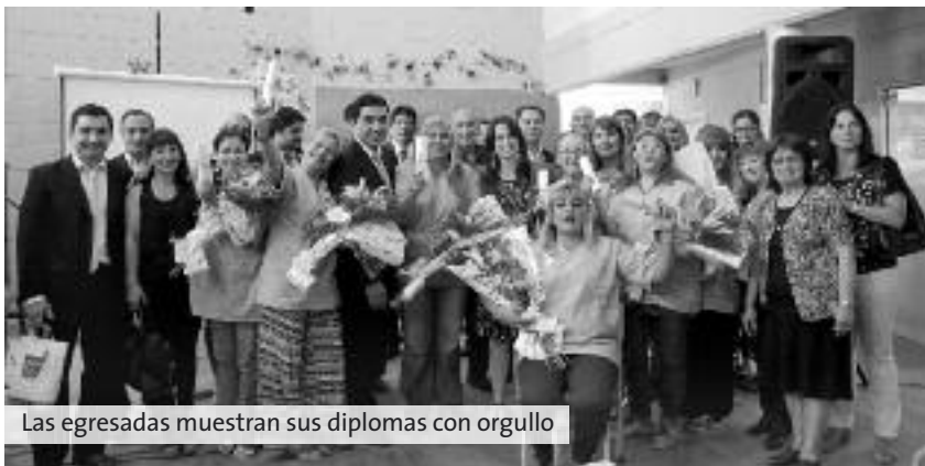
Las egresadas muestran sus diplomas con orgullo