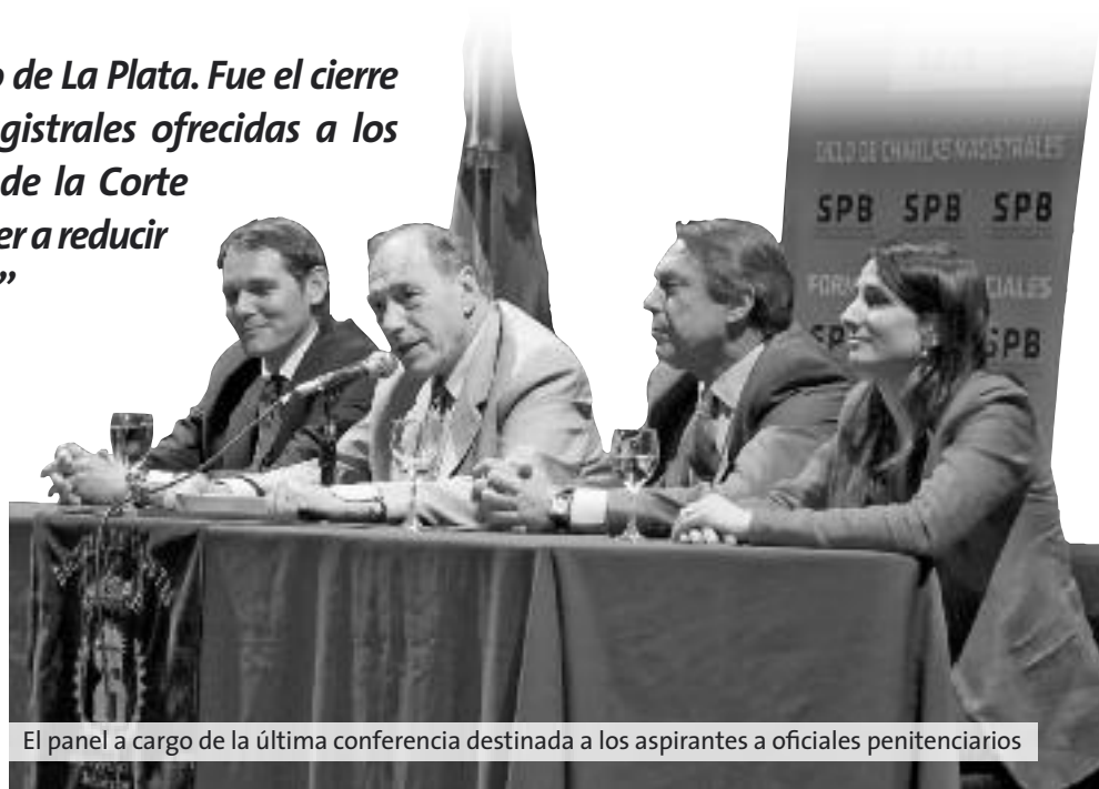
El panel a cargo de la última conferencia destinada a los aspirantes a oficiales penitenciarios