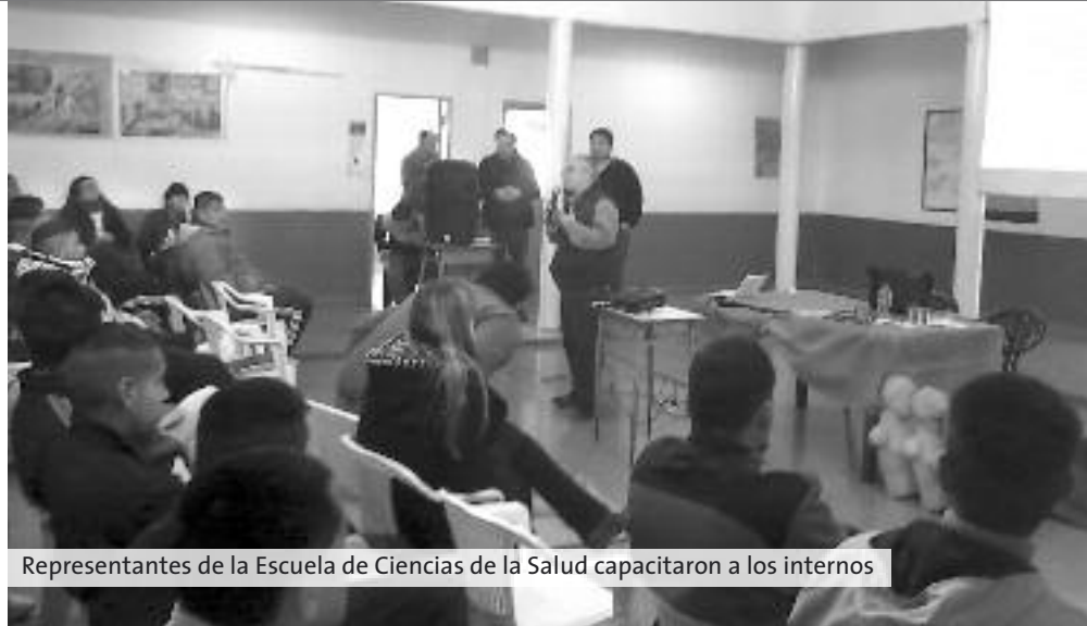
Representantes de la Escuela de Ciencias de la Salud capacitaron a los internos