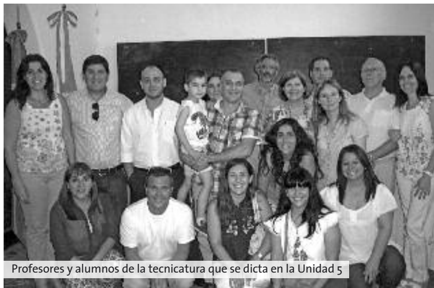
Profesores y alumnos de la tecnicatura que se dicta en la Unidad 5

Por último se entregaron las medallas y certificados de estudio a los egresados que estaban acompañados por familiares, autoridades escolares, docentes e invitados especiales para este momento tan especial.