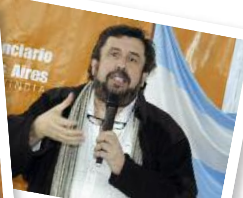
Mariano Lúdice, Luis Ventura y Alejandro Apo fueron algunos de los famosos que visitaron la cárcel de La Matanza y dialogaron con los internos