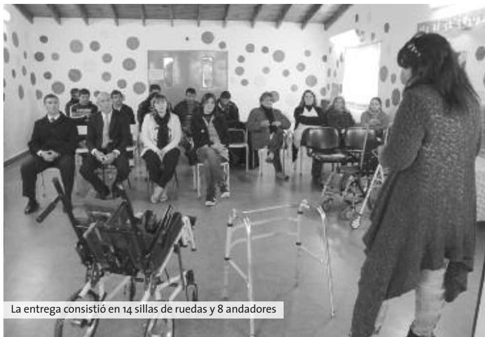
La entrega consistió en 14 sillas de ruedas y 8 andadores

A partir de un trabajo interinstitucional, detenidos de Florencio Varela repararon los artefactos que usan para movilizarse los niños que asisten a una escuela especial de la región