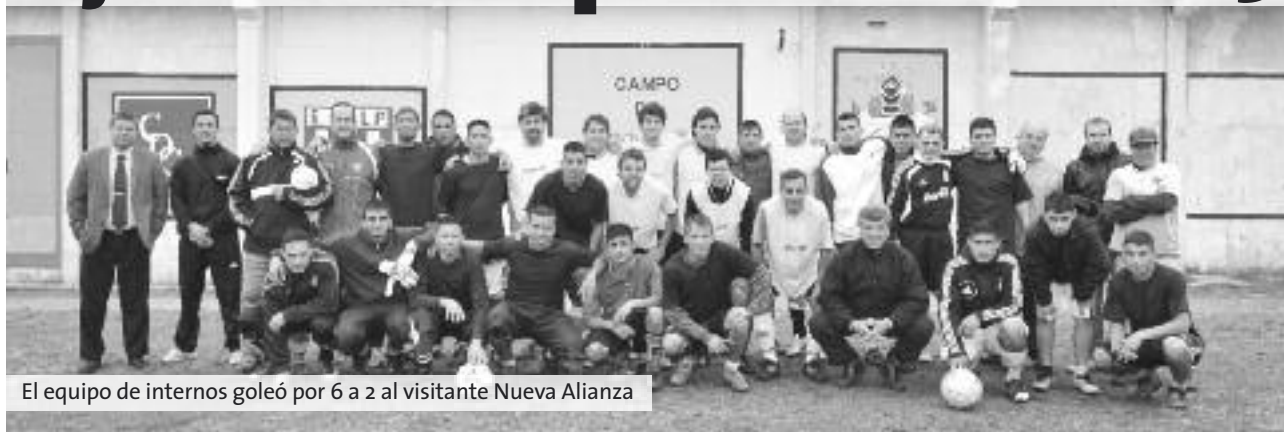
El equipo de internos goleó por 6 a 2 al visitante Nueva Alianza