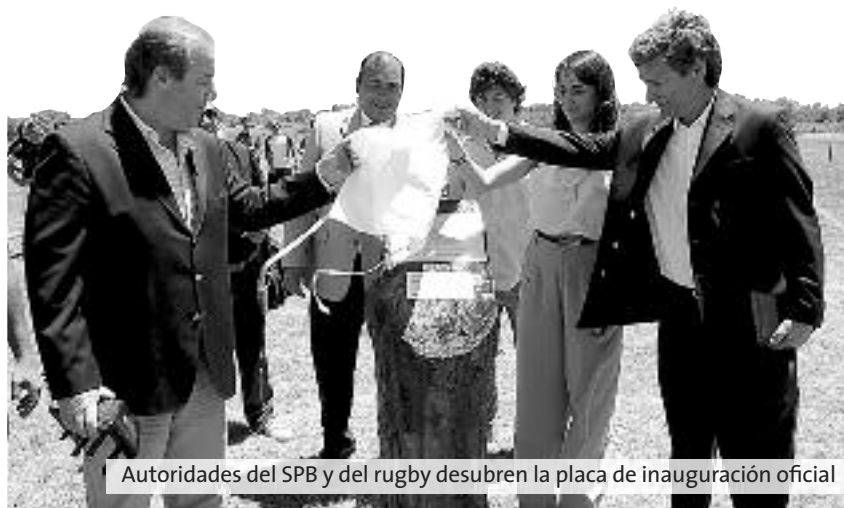
Autoridades del SPB y del rugby desubren la placa de inauguración oficial

El equipo de la Unidad 12 tiene el nombre de Coñalef , que signi-