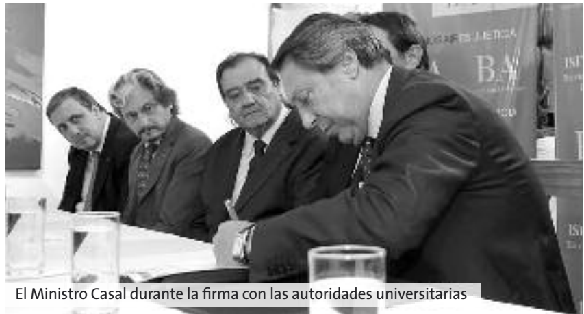
El Ministro Casal durante la firma con las autoridades universitarias

Asimismo, Casal anunció que se está proyectando la “construcción de cuatro nuevas unidades penitenciarias que se llamarán Unidades de Educación