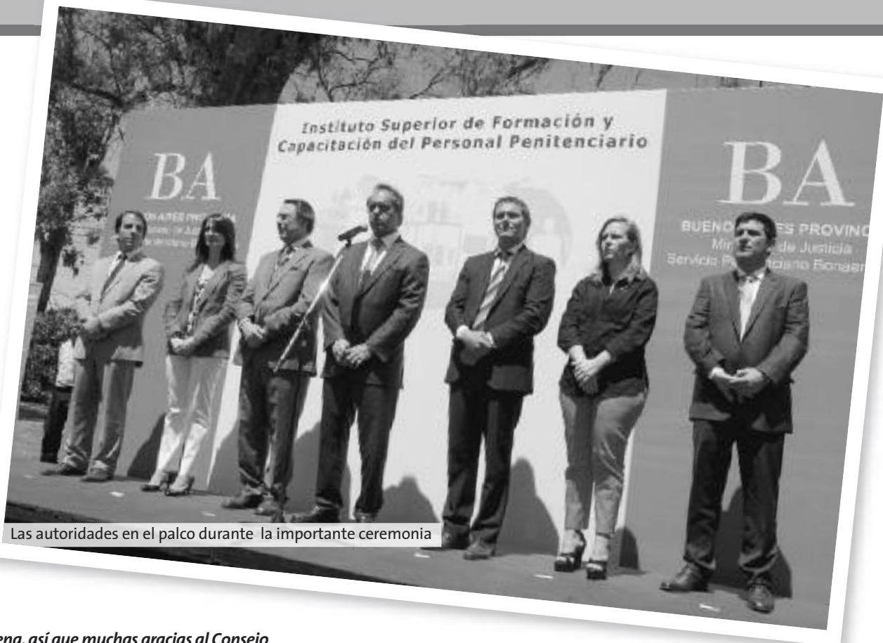
Las autoridades en el palco durante la importante ceremonia

pena, así que muchas gracias al Consejo Académico por ayudarnos siempre”.