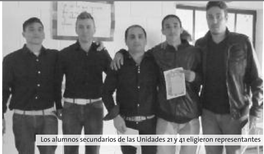
Los alumnos secundarios de las Unidades 21 y 41 eligieron representantes