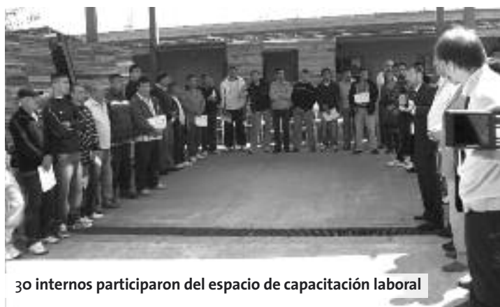
30 internos participaron del espacio de capacitación laboral