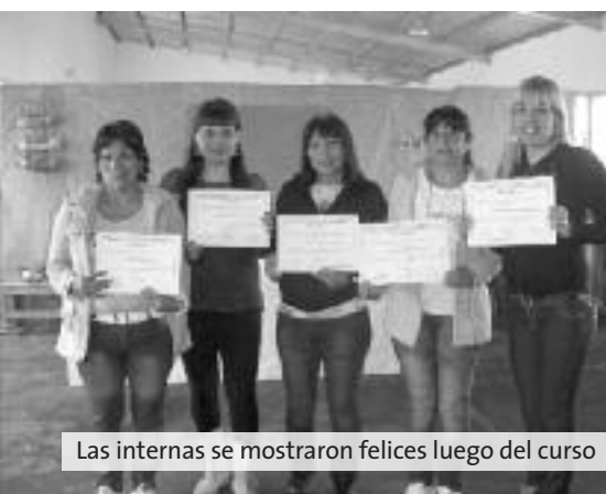
Las internas se mostraron felices luego del curso

A fines de octubre, en la Unidad 51 femenina de Magdalena, se hizo entrega a cinco internas de los certificados correspondientes a la finalización del Curso de Panadería que se desarrolló en la sección Talleres de esta dependencia.