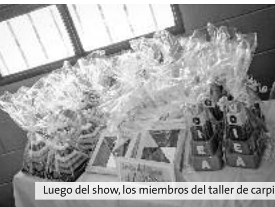
Luego del show, los miembros del taller de carpintería donaron juegos didácticos para chicos