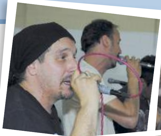
La Bersuit en acción en el SUM de la Unidad 43