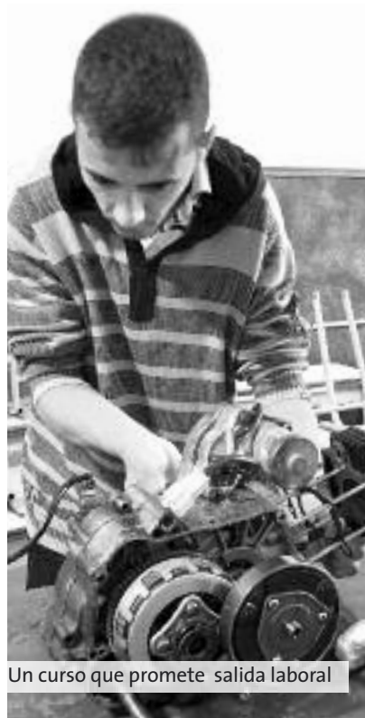
Un curso que promete salida laboral

Además, el Ministerio de Trabajo de la Nación aporta un Seguro de Capacitación y Empleo para los alum-