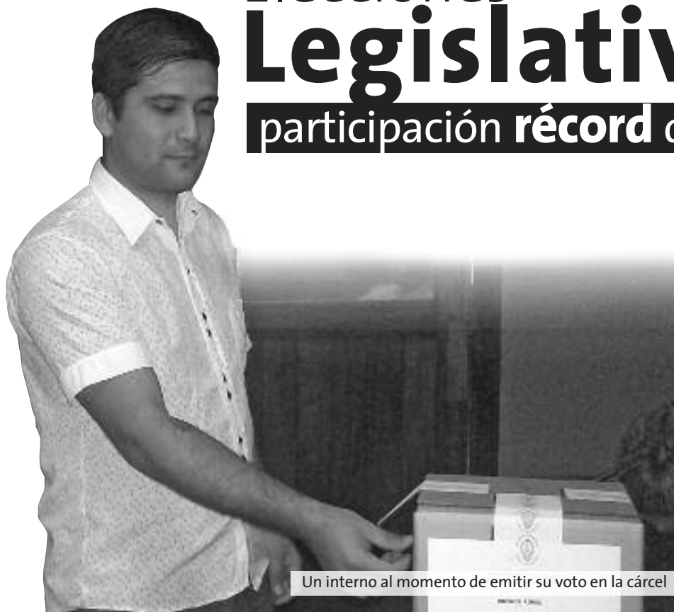
Un interno al momento de emitir su voto en la cárcel

La participación en las elecciones por parte de detenidos en cárceles de la provincia de Buenos Aires llegó a su récord histórico el pasado domingo 27 de octubre al votar un 30 por ciento más que durante las PASO (primarias abiertas simultáneas y obligatorias) de agosto último.