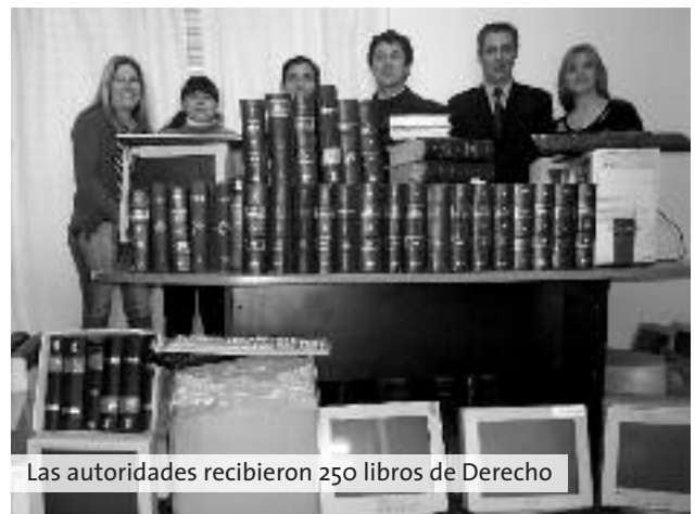
Las autoridades recibieron 250 libros de Derecho