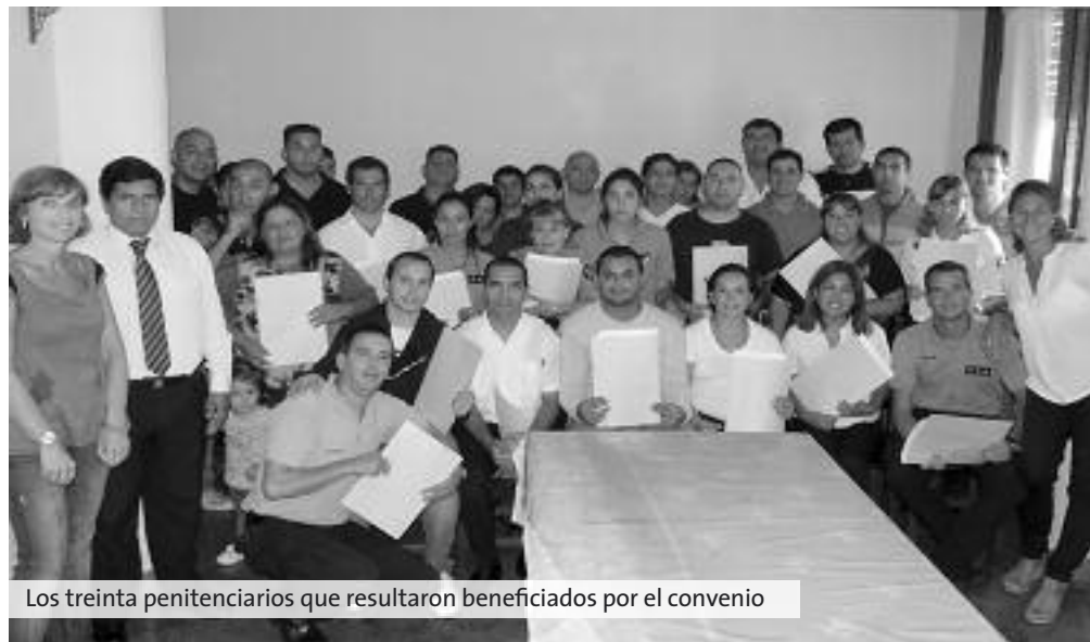
Los treinta penitenciarios que resultaron beneficiados por el convenio