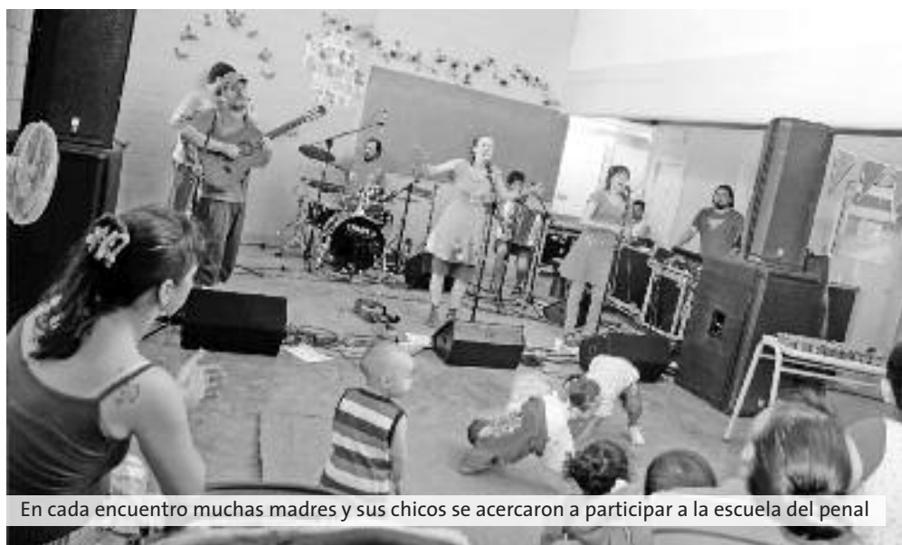
En cada encuentro muchas madres y sus chicos se acercaron a participar a la escuela del penal