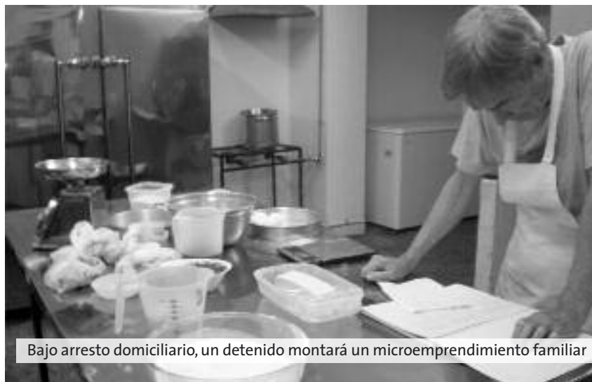
Bajo arresto domiciliario, un detenido montará un microemprendimiento familiar

Un ejemplo de esto es la oferta brindada desde el Centro de Industrias Panaderos de Mar del Plata, que consistió en un curso gratuito de auxiliar en panadería, abierto a toda la comunidad y que permitió el ingreso de un interno de esta unidad, y después se sumó su esposa, y se dieron a la tarea de aprender para formar un futuro juntos.