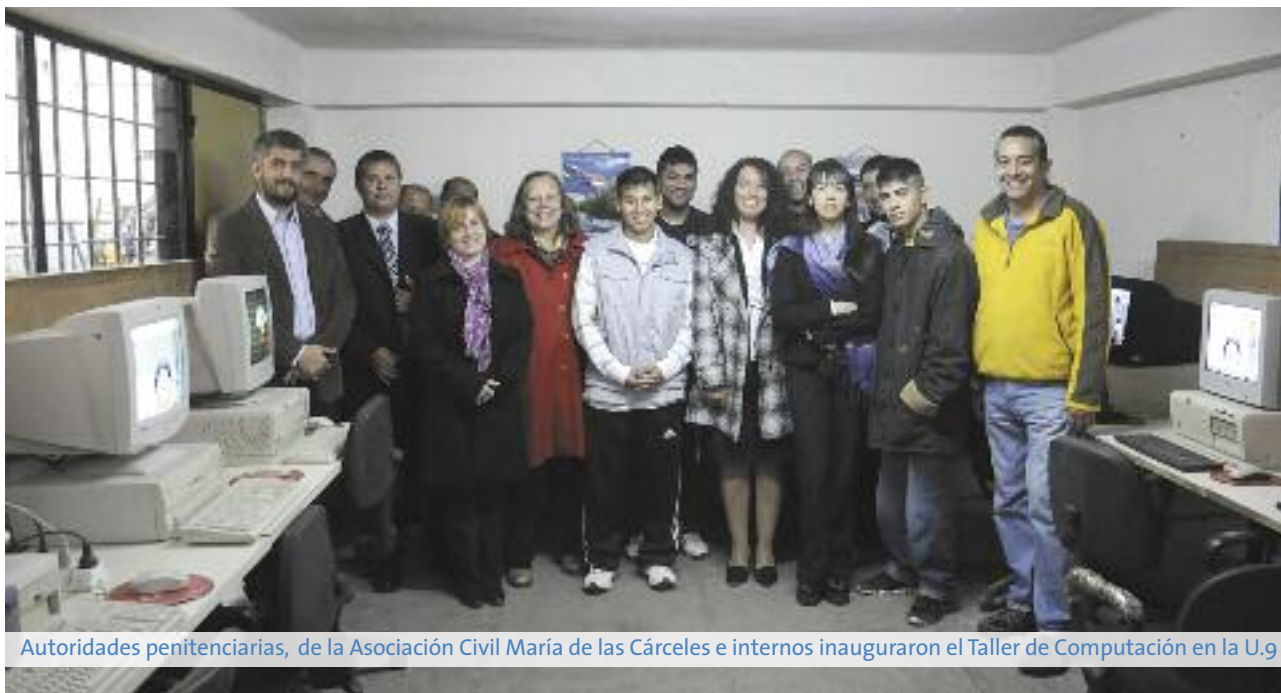
Autoridades penitenciarias, de la Asociación Civil María de las Cárceles e internos inauguraron el Taller de Computación en la U.9