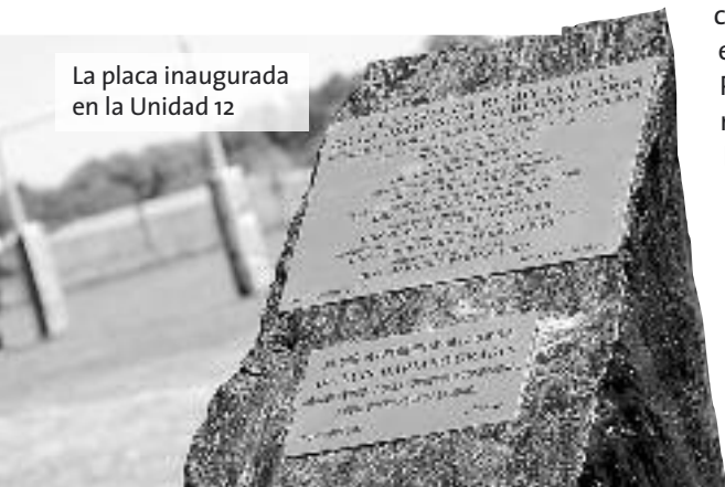
La placa inaugurada en la Unidad 12