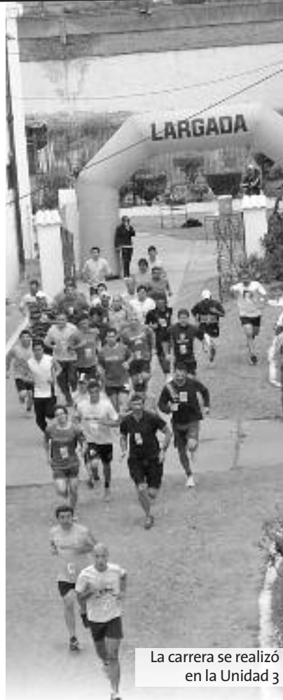
La carrera se realizó en la Unidad 3

Finalizada la actividad deportiva, se realizó en el salón de usos múltiples de la escuela que funciona en el penal, la entrega de certificados a todos los participantes y correspon-