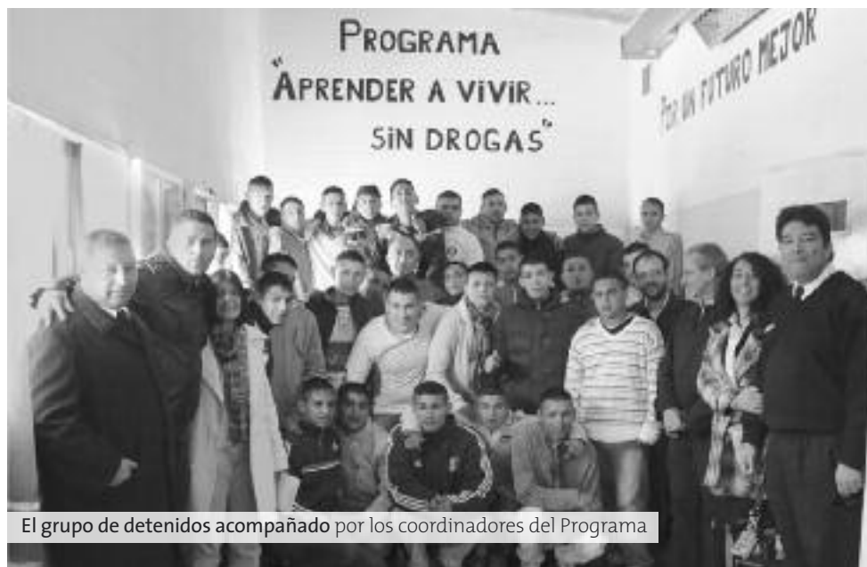
El grupo de detenidos acompañado por los coordinadores del Programa