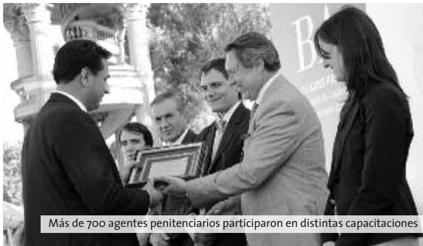
Más de 700 agentes penitenciarios participaron en distintas capacitaciones

El ministro de Justicia, Ricardo Casal , presidió el 28 de noviembre la ceremonia de finalización del ciclo lectivo 2013 del personal penitenciario, en la que se entregaron premios y certificados a los oficiales y suboficiales que realizaron cursos de capacitación y perfeccionamiento, en un evento que se llevó a cabo en la Escuela de Cadetes.