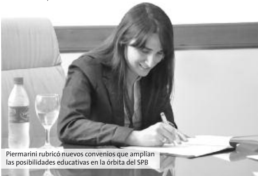
Piermarini rubricó nuevos convenios que amplían las posibilidades educativas en la órbita del SPB