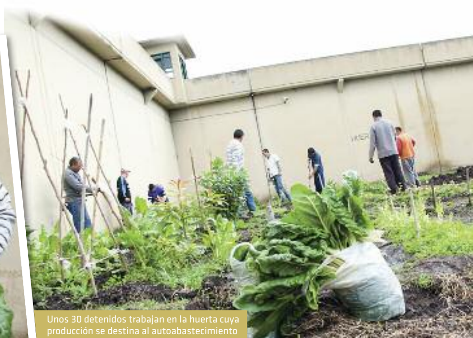
Unos 30 detenidos trabajan en la huerta cuya producción se destina al autoabastecimiento