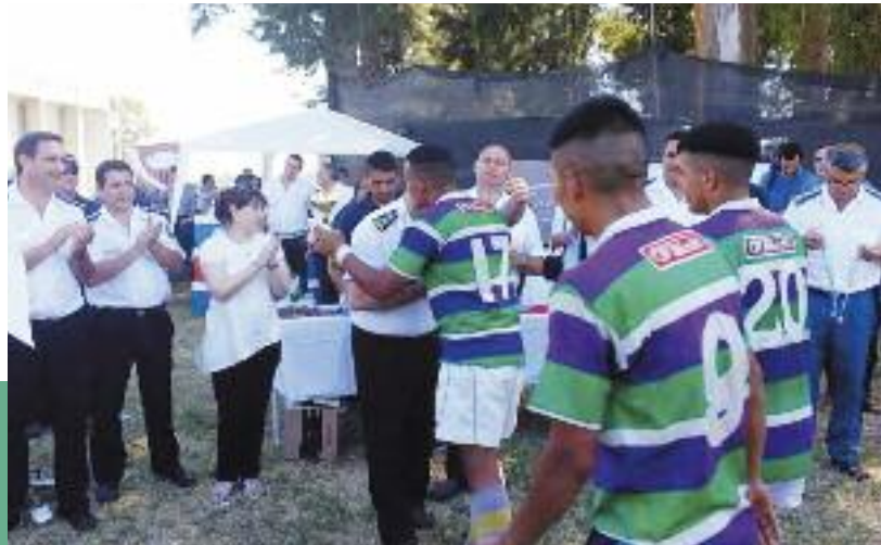
Entrega de premios y tercer tiempo entre autoridades y detenidos de la U41, U6, U48 y U46

Ustedes están aquí aprovechándolas. Ese es el inicio de un gran camino".