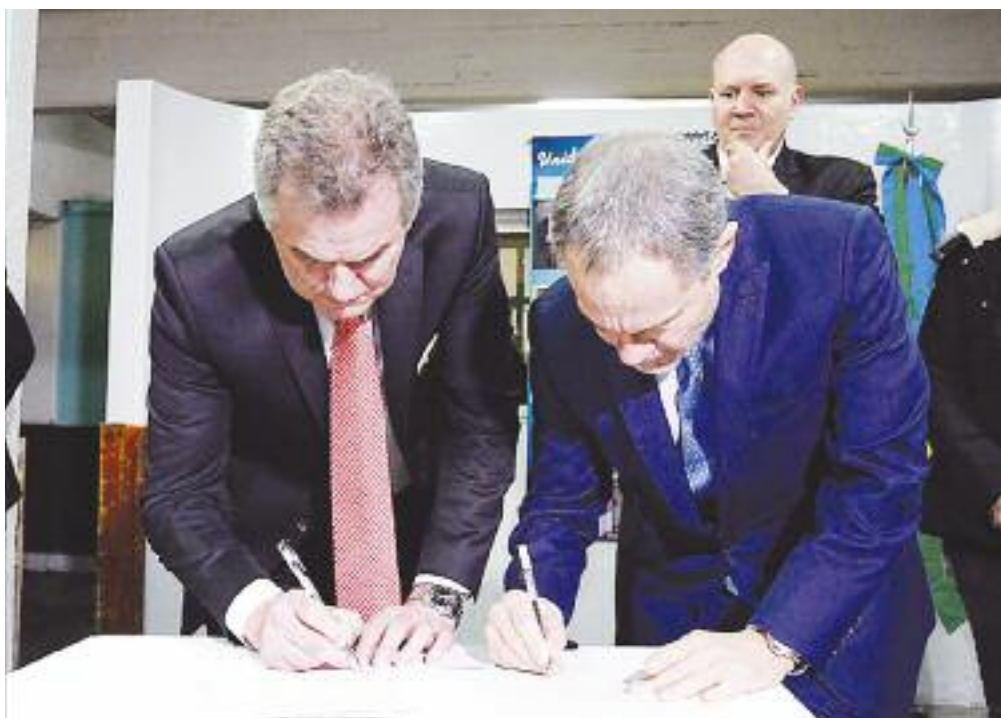
El ministro Ferrari y el intendente Gay firmaron convenios de cooperación mutua para que los internos desarrollen actividades laborales y accedan a distintas capacitaciones

El ministro de Justicia de la Provincia, Gustavo Ferrari , visitó el 11 de agosto la Unidad 4 Bahía Blanca, donde junto al intendente local, Héctor Gay , firmaron convenios de cooperación para que los internos efectúen la reparación de mobiliario escolar y carpintería metálica, luminaria pública y fabricación de productos premoldeados; y el dictado de cursos teórico-prácticos que promueven el desarrollo de habilidades específicas destinados a los internos de 18 a 24 años.