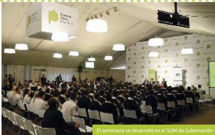
El seminario se desarrolló en el SUM de Gobernación