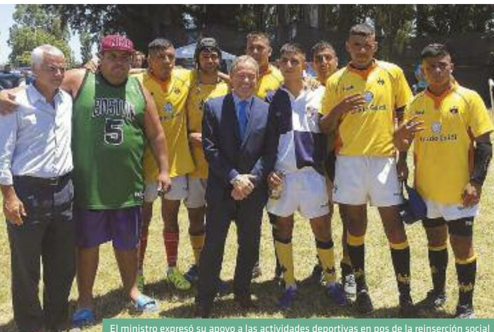
El ministro expresó su apoyo a las actividades deportivas en pos de la reinserción social

Luego de las palabras del ministro, se disputaron los partidos que culminaron con la tradicional entrega de medallas y trofeos ante todos los presentes, entre los que se encontraban los familiares de los detenidos que tuvieron la oportunidad de presenciar el torneo.