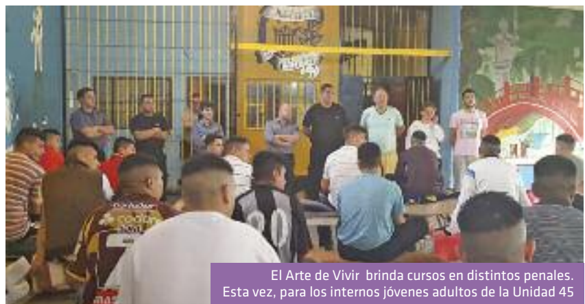
El Arte de Vivir brinda cursos en distintos penales. Esta vez, para los internos jóvenes adultos de la Unidad 45

Hasta diciembre próximo los internos contarán con una visita semanal por parte de los talleristas a fin de ir guiando el trabajo de meditación y relajación.