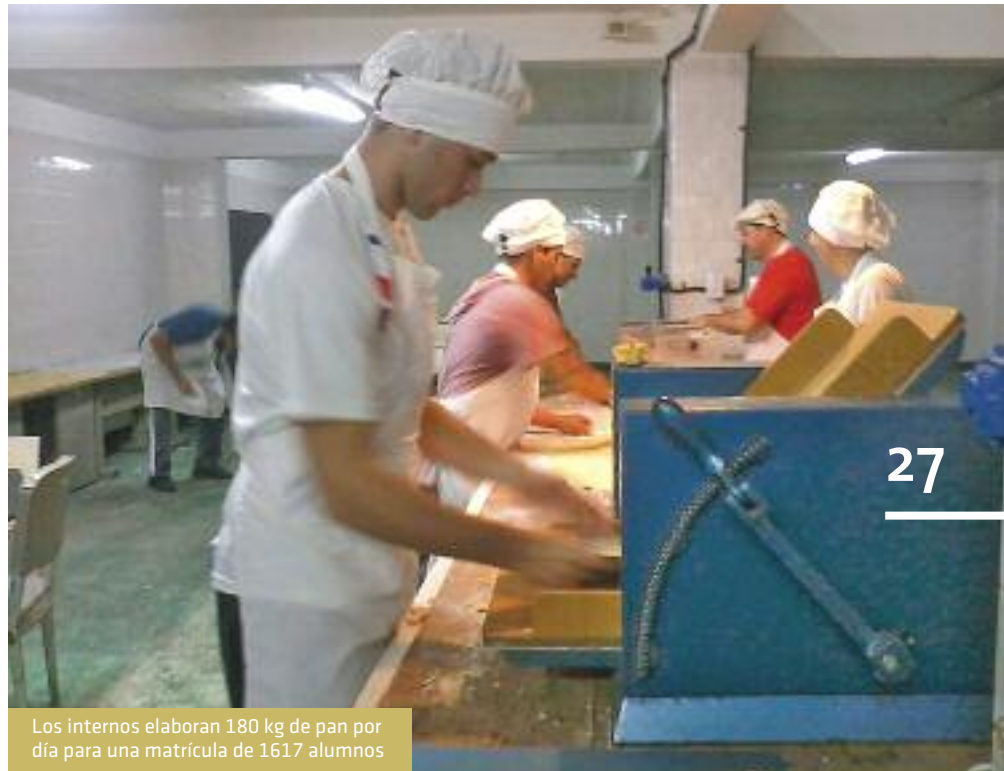
Los internos elaboran 180 kg de pan por día para una matrícula de 1617 alumnos

Según se informó, el Consejo compra los insumos y abona la mano de