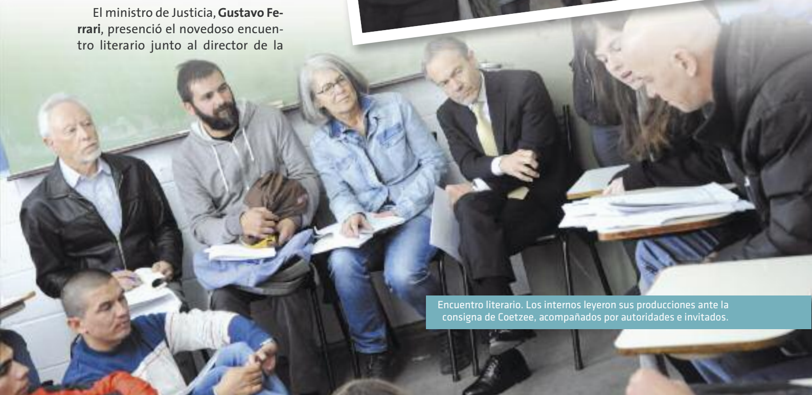
Encuentro literario. Los internos leyeron sus producciones ante la consigna de Coetzee, acompañados por autoridades e invitados.