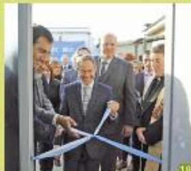
El ministro de Justicia inauguró aulas en Junín