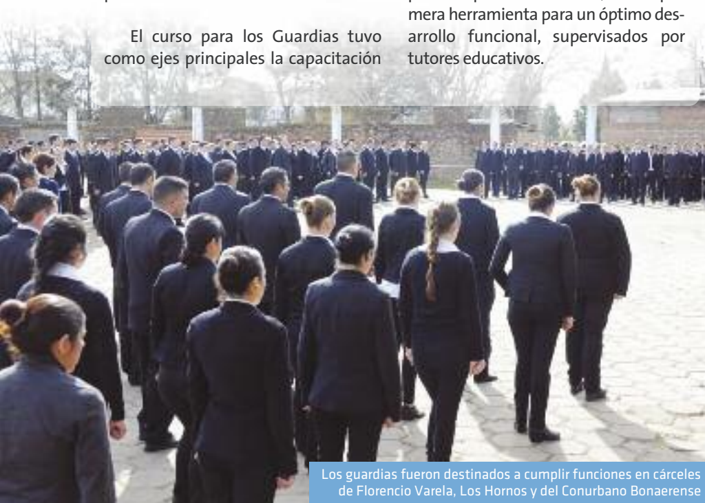
Los guardias fueron destinados a cumplir funciones en cárceles de Florencio Varela, Los Hornos y del Conurbano Bonaerense

En la primera etapa se cursaron asignaturas teóricas y contó con un espacio de inserción institucional donde se realizaron visitas a más de 20 cárceles. En tanto, en la segunda etapa, cada guardia en su destino desarrollará una práctica profesionalizante, como primera herramienta para un óptimo desarrollo funcional, supervisados por tutores educativos.