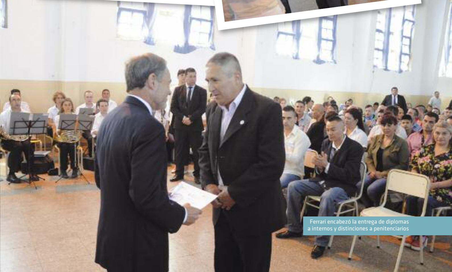
Ferrari encabezó la entrega de diplomas a internos y distinciones a penitenciarios