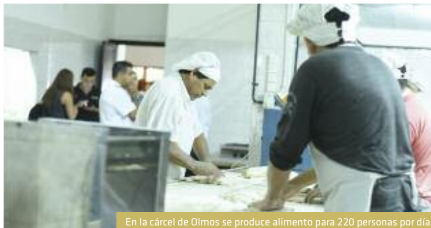
En la cárcel de Olmos se produce alimento para 220 personas por día

Para eso, y según cuenta Miguel Magdalena , se proyectan cursos de marketing y todo lo necesario para que los proyectos sean viables.