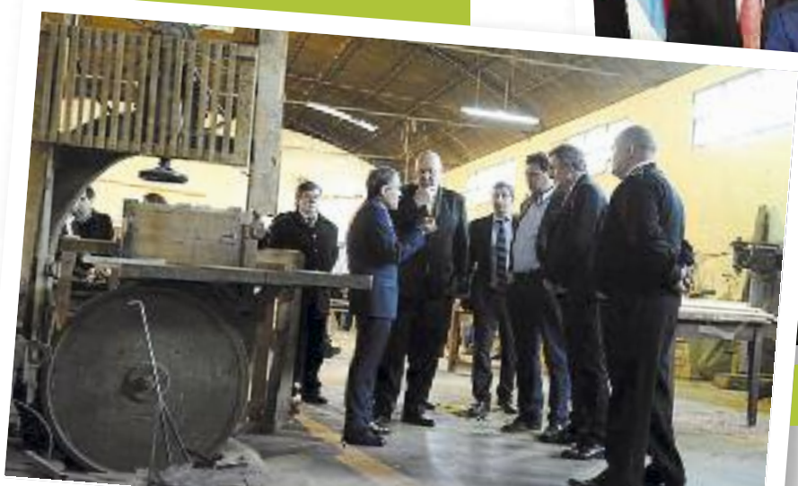
Las autoridades en uno de los talleres de la U 4