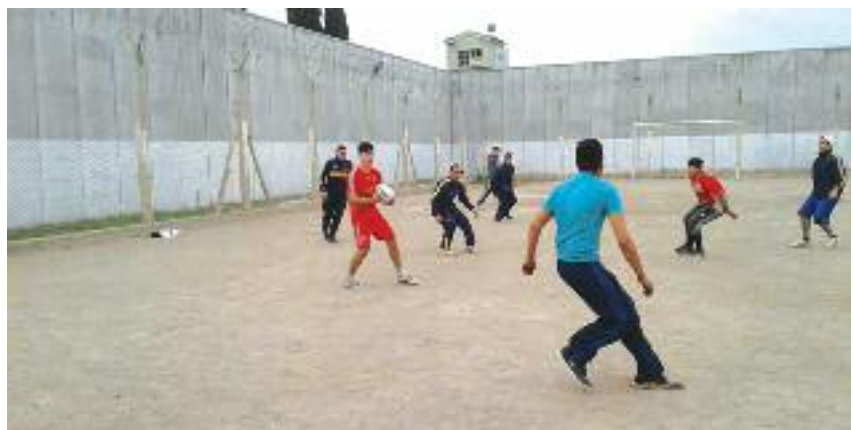
Se reactivó la práctica del rugby en la Unidad 4, con una gran adhesión de internos

Además, jugó como fullback en equipos de Inglaterra, Escocia y Francia.