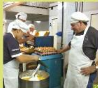
Cárcel de Mercedes abastece de pan a escuelas locales