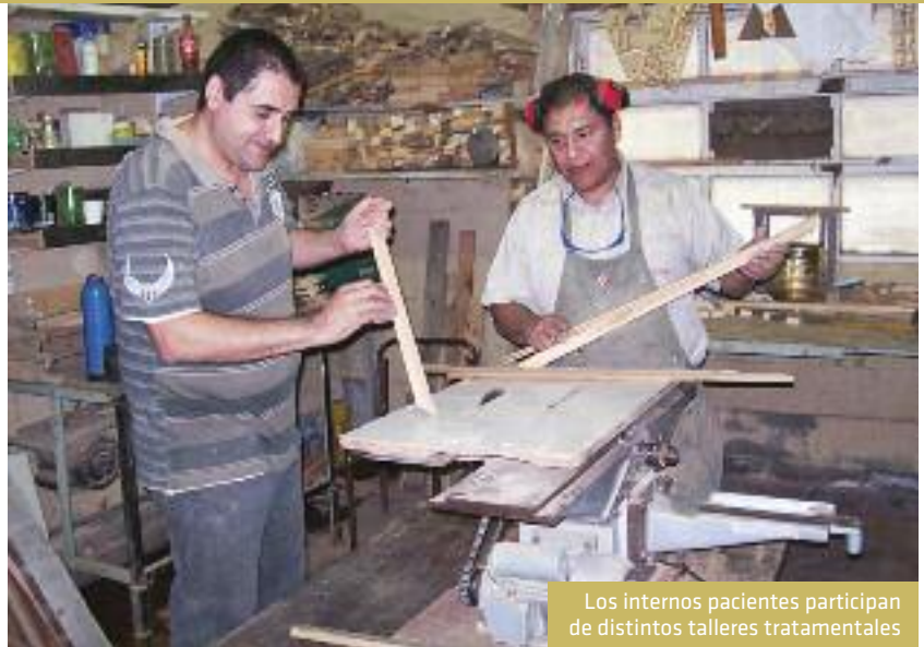
Los internos pacientes participan de distintos talleres tratamentales

nes de indumentarias en iglesias u ONG. Es que muchos no reciben visitas y no tienen recambio de vestimenta”.