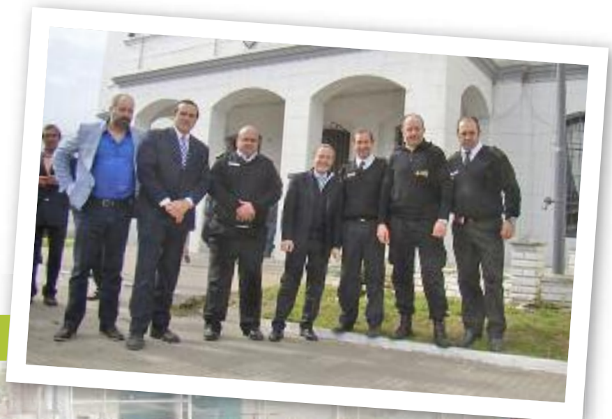
Gustavo Ferrari, en el centro. Lo acompañan autoridades locales

Luego, el ministro recorrió las instalaciones de los Módulos A y B, que se encuentran en construcción para alojar internos del Régimen semiabierto. Continuó su recorrido por la Sección Vigi-