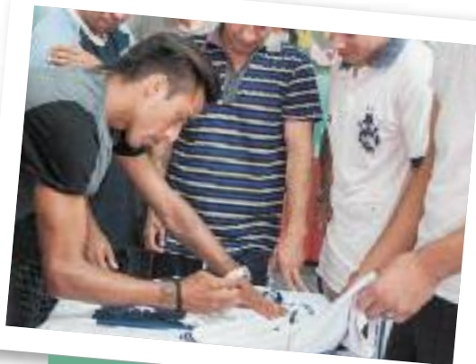
Los jugadores del Lobo compartieron una tarde entretenida con los privados de libertad

Uno de los internos dijo que “la visita de los jugadores es algo fantástico,