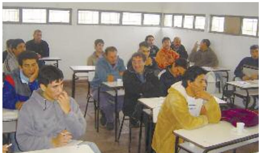
Los internos de Batán egresan con el título de "Técnico en equipos e instalaciones electromecánicas"

el ciclo lectivo 2008. A partir del 2011 se decidió cambiar el plan de estudios, que comprime las modalidades en el mismo turno (aula y taller), funcionando en la actualidad con 1º, 2º a la tarde, y 3º y 4º a la mañana.