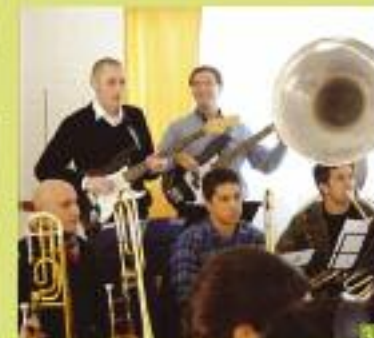
La Banda lleva su música a la población carcelaria