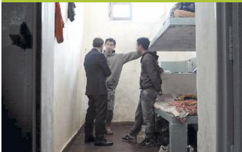
Los funcionarios recorrieron el establecimiento carcelario, donde el ministro charló con los privados de libertad, tanto en el sector masculino como en el anexo femenino