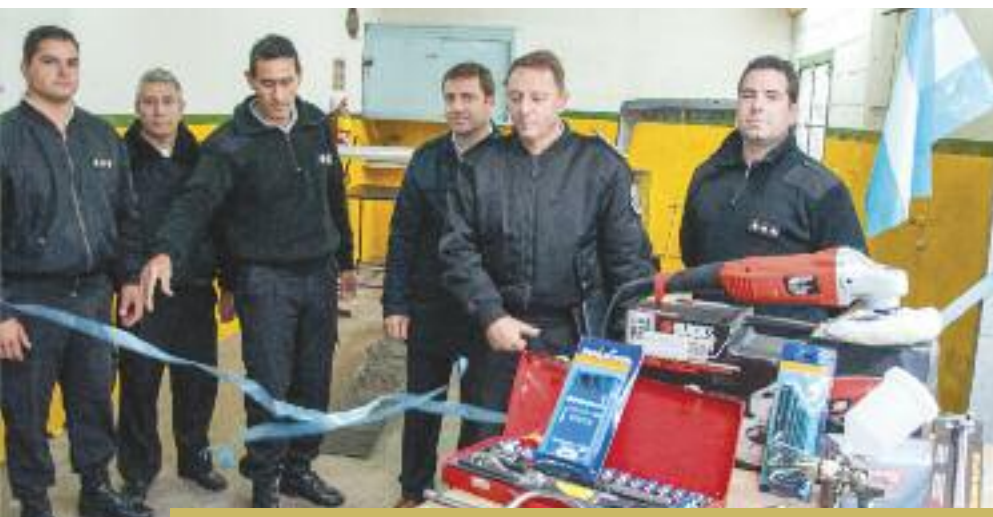
Unidad 18. Las autoridades entregaron las herramientas para el funcionamiento del taller

En estos meses, también comenzaron a funcionar talleres de este tipo en la Unidad 38 Sierra Chica, Unidad 4 Bahía Blanca, Unidad 9 La Plata y Unidad 16 Junín.