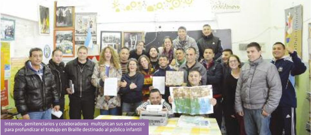
Internos, penitenciarios y colaboradores multiplican sus esfuerzos para profundizar el trabajo en Braille destinado al público infantil

En el marco del proyecto “ Libros que cuentan, manos que leen ” que se realiza en conjunto entre el taller El Ágora, conformado por internos de la Unidad 9 La Plata, y la Biblioteca Del otro lado del árbol, esta entidad entregó en comodato una máquina Perkins Braille para acelerar la obra solidaria que se lleva a cabo dentro del penal a favor de las personas no videntes o con disminución visual.