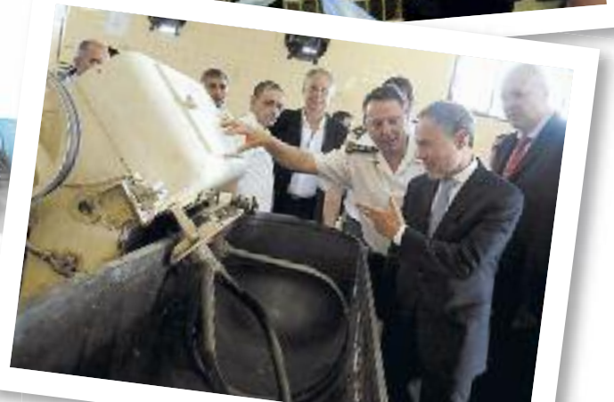
Ferrari y Baric inauguraron más aulas para profundizar la capacitación laboral de los detenidos