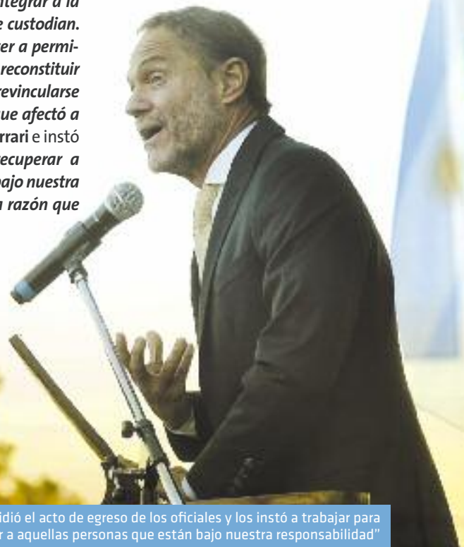
Ferrari presidió el acto de egreso de los oficiales y los instó a trabajar para “recuperar a aquellas personas que están bajo nuestra responsabilidad”