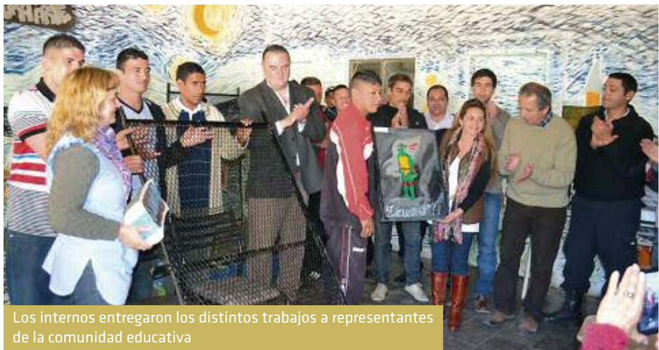
Los internos entregaron los distintos trabajos a representantes de la comunidad educativa