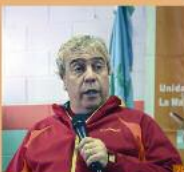
Coco Silly, un "animal suelto" en la Unidad 43