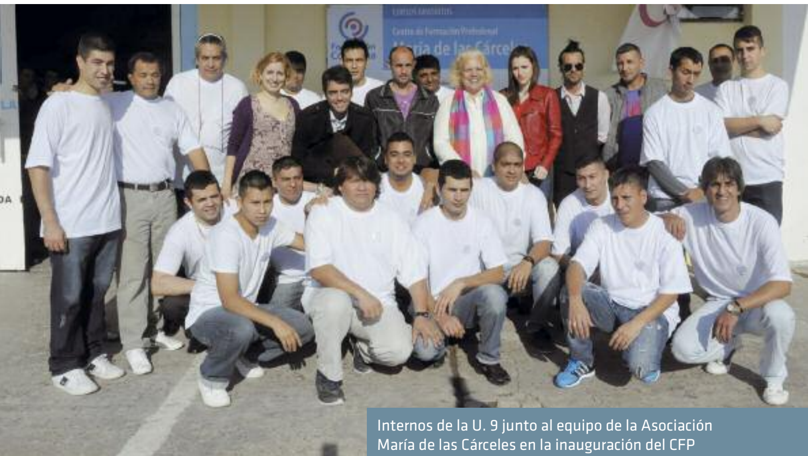
Internos de la U. 9 junto al equipo de la Asociación María de las Cárceles en la inauguración del CFP