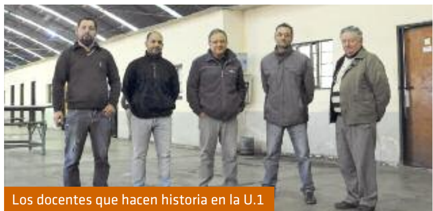
Los docentes que hacen historia en la U.1