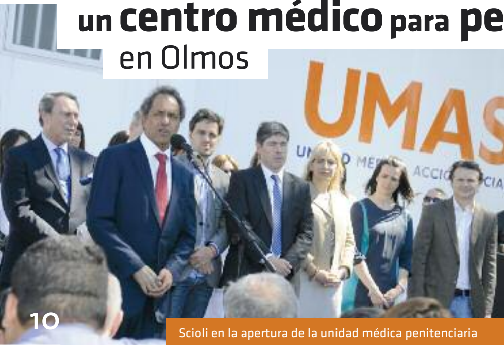
Scioli en la apertura de la unidad médica penitenciaria