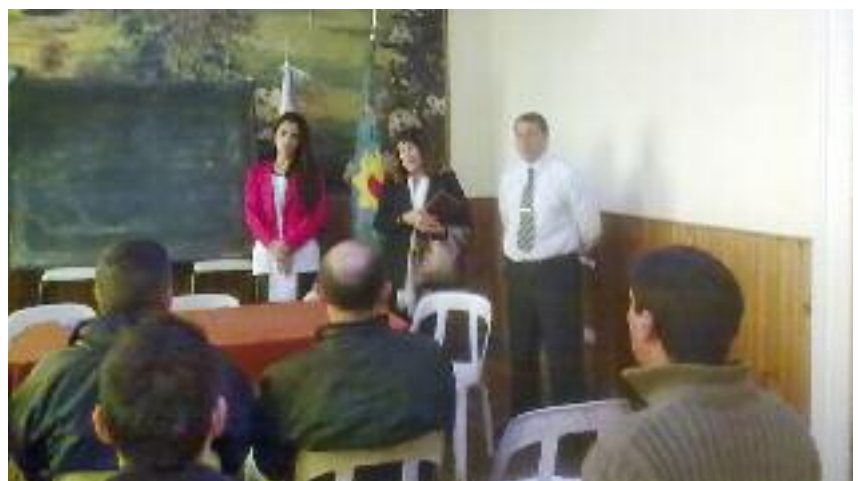
25 agentes retomaron sus estudios secundarios en la cárcel de Dolores

superiores, todos beneficios y enriquecimientos personales, pero que en definitiva se trasladarán sin dudas a la labor penitenciaria.