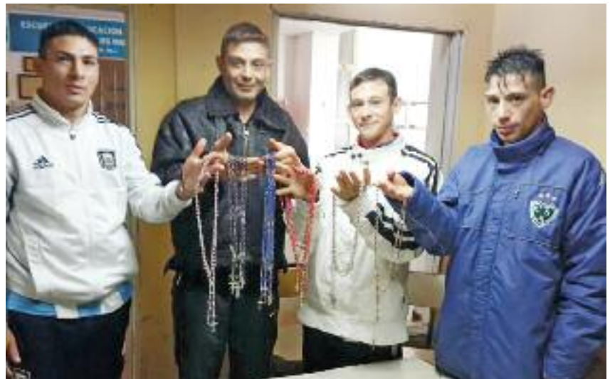
Los detenidos ya obsequiaron más de 300 rosarios

El otro cincuenta por ciento de lo realizado es donado a distintas instituciones. En lo que va del mes se entregaron 180 rosarios a la escuela Cristo Rey de la localidad de Caseros, 90 rosarios a la Comisaría de la Mujer de la localidad de Junín (B), y en estos días se está obsequiando un rosario a cada empleado de la Unidad 13.