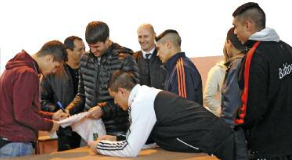
El momento de los autógrafos y firma de camisetas