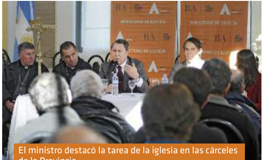
El ministro destacó la tarea de la iglesia en las cárceles de la Provincia