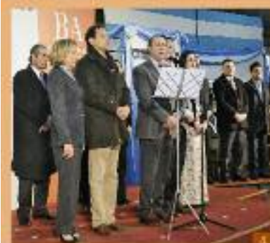
Futuros Oficiales juraron fidelidad a la bandera