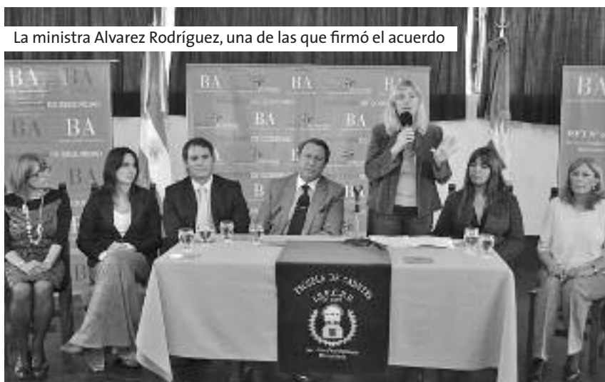
La ministra Álvarez Rodríguez, una de las que firmó el acuerdo

Se implementarán espacios de tratamiento y capacitación que contemplen una mirada integral de esta problemática. Las actividades, destinadas tanto para los cadetes y funcionarios penitenciarios como para los internos, se coordinarán junto al Consejo Provincial de las Mujeres