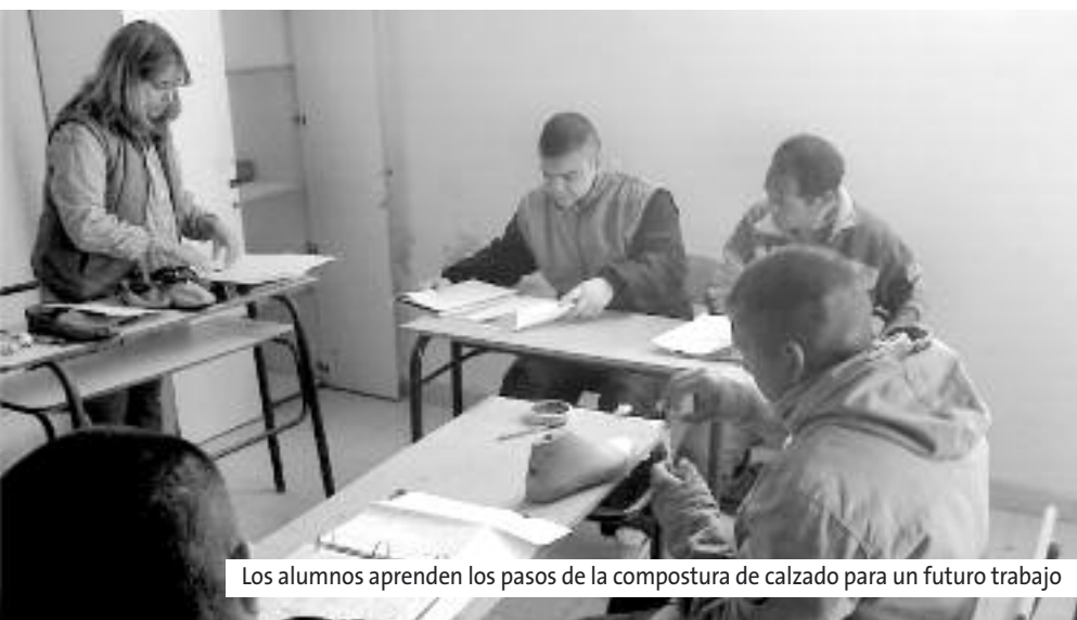
Los alumnos aprenden los pasos de la compostura de calzado para un futuro trabajo

Un taller de aparado de calzados se sumó a la oferta de cursos que se ofrecen a los internos de Sierra Chica con el fin de enseñar distintos oficios, herramientas que servirán como salida laboral al momento de recuperar su libertad