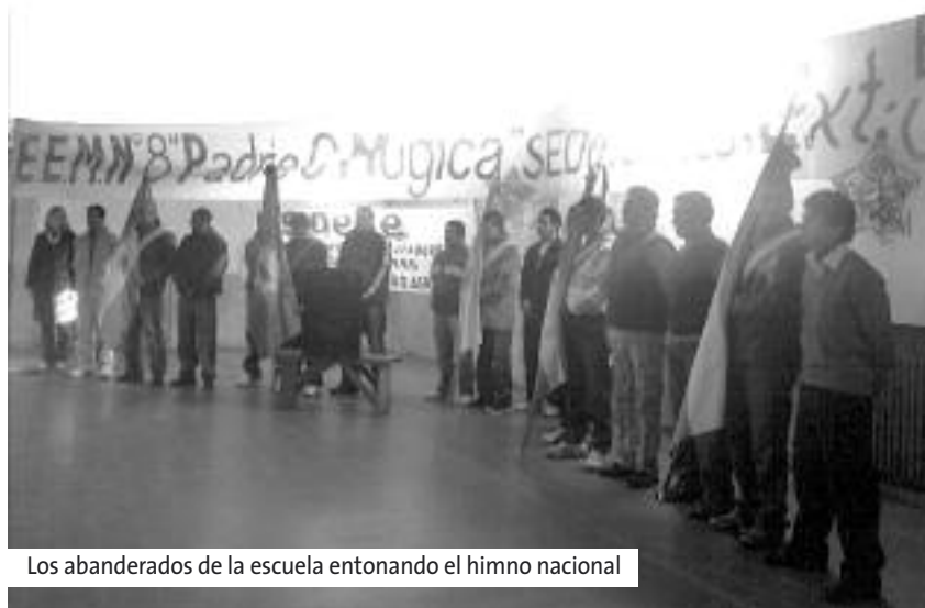
Los abanderados de la escuela entonando el himno nacional

Se trata de la EEM N° 8 “Carlos Mugica” de la Unidad 13 Junín, en la que estudian más de 300 alumnos. Fue la primera de la provincia de Buenos Aires y Sudamérica creada en contexto de encierro