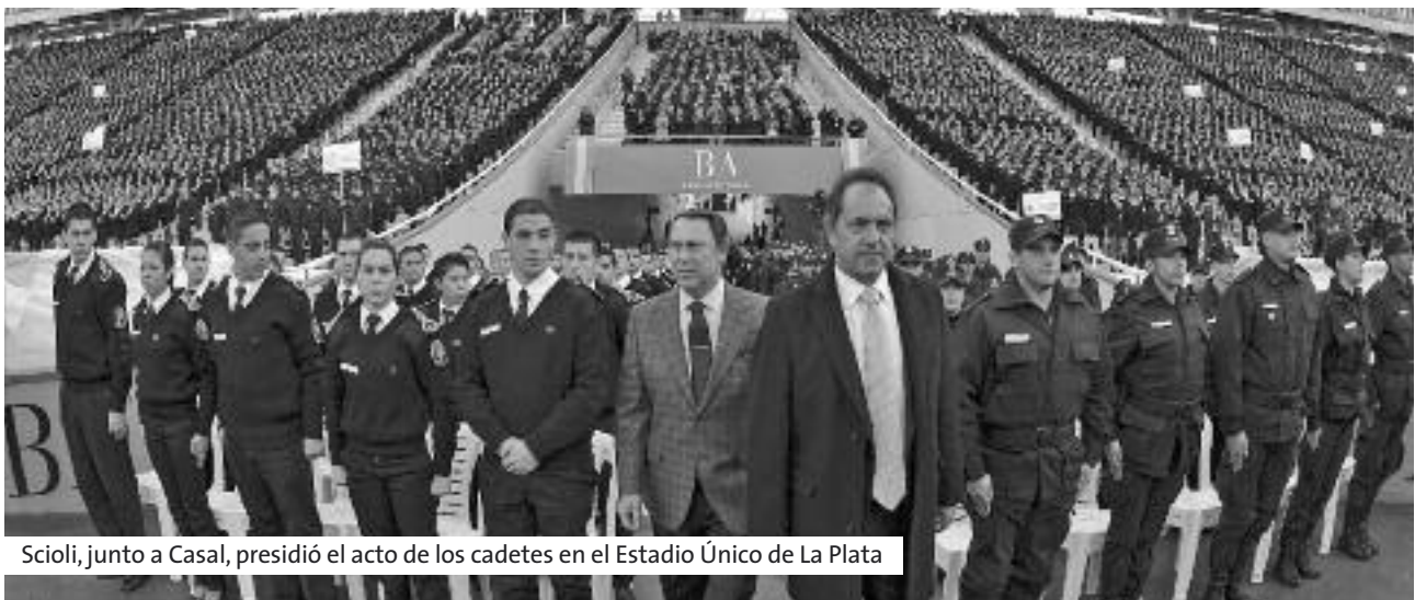
Scioli, junto a Casal, presidió el acto de los cadetes en el Estadio Único de La Plata

Para finalizar Daniel Scioli anunció el inicio del ciclo lectivo para los Institutos Superiores de Formación, tanto penitenciarios como policiales de la provincia de Buenos Aires.