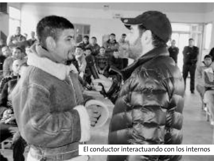
El conductor interactuando con los internos