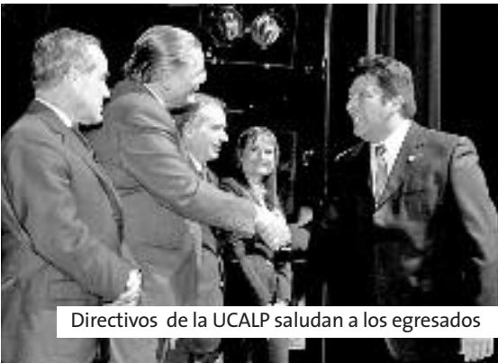
Directivos de la UCALP saludan a los egresados