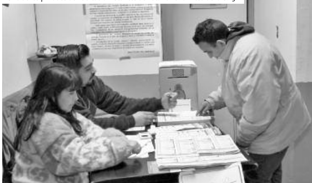
Uno de los privados de libertad a instantes de votar en una mesa de la U.23

su vez, a cada una de las Juntas Electorales Nacionales con asiento en cada distrito del país.