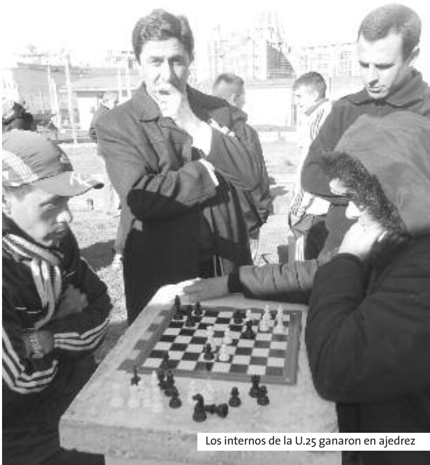
Los internos de la U.25 ganaron en ajedrez