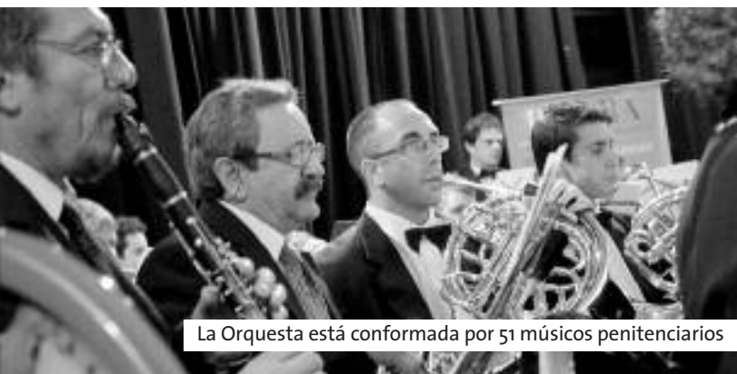
La Orquesta está conformada por 51 músicos penitenciarios