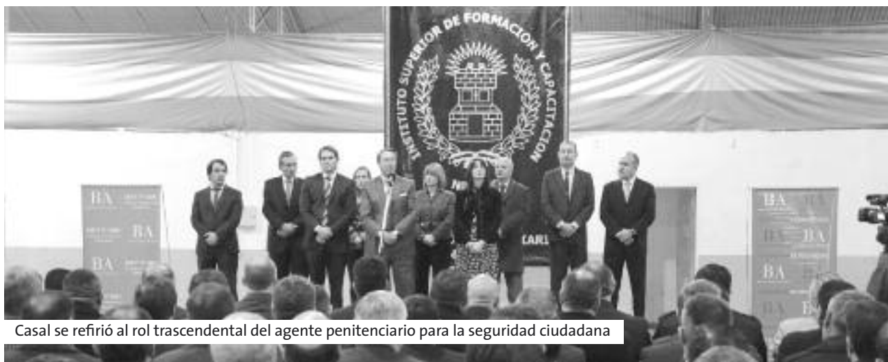
Casal se refirió al rol trascendental del agente penitenciario para la seguridad ciudadana