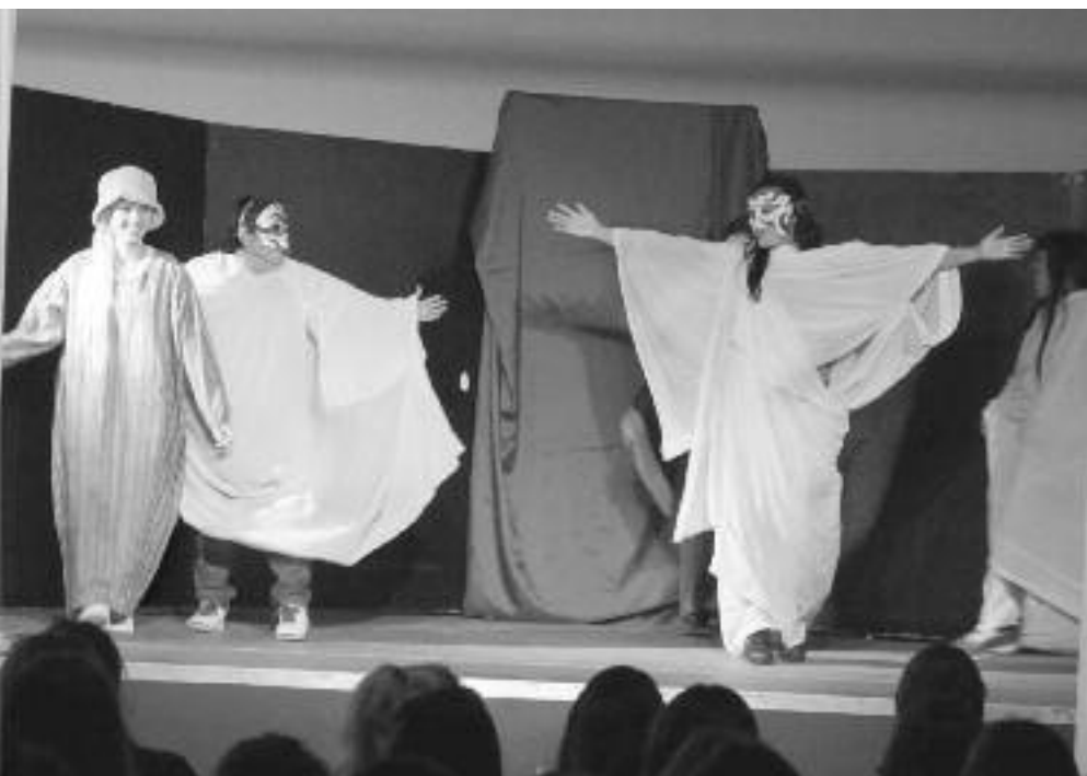
Las detenidas de Los Hornos sobre el escenario del Liceo

Esta modalidad fue propuesta por el Prof. Di Benedetto, quien también dirige el grupo de teatro “Expresarte” conformado por detenidas de la Unidad 33 Los Hornos, que ya actuaron en distintas ocasiones en colegios de la zona con el fin de mostrar su trabajo dentro del penal y juntar alimentos para donar a la obra del Padre Cajade y a barrios carenciados.