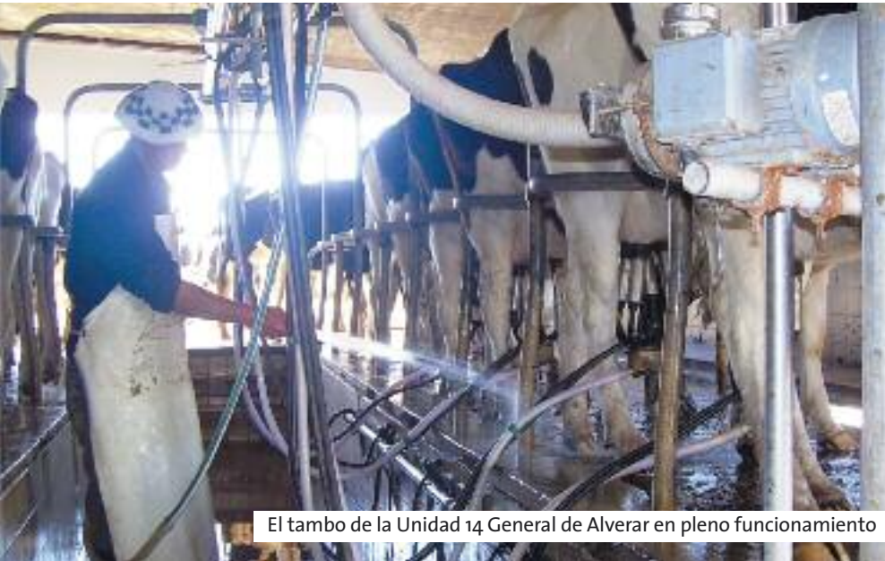
El tambo de la Unidad 14 General de Alvear en pleno funcionamiento

La Unidad 14 se creó en 1970 bajo la denominación de Destacamento General Alvear, hasta el 5 de enero de 1979, que pasó al rango de Unidad. Actualmente aloja internos procesados como también penados con régimen semiabierto y cuenta además con sector de régimen abierto.