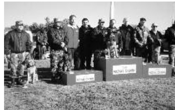
Los premiados en el Torneo de Adiestramiento

Es oportuno destacar que el Departamento Perros fue creado el 23 de marzo de 1968 y desde ese momento sus integrantes realizan trabajos de alta complejidad, tanto en capacitación, como en especialización de los canes, considerados los mejores de su tipo.