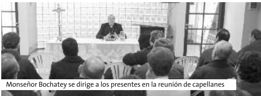
Monseñor Bochaty se dirige a los presentes en la reunión de capellanes

A mediados de junio se desarrolló el primer encuentro anual de capellanes del SPB, presidido por el nuevo obispo auxiliar de La Plata, monseñor Alberto Bochaty .