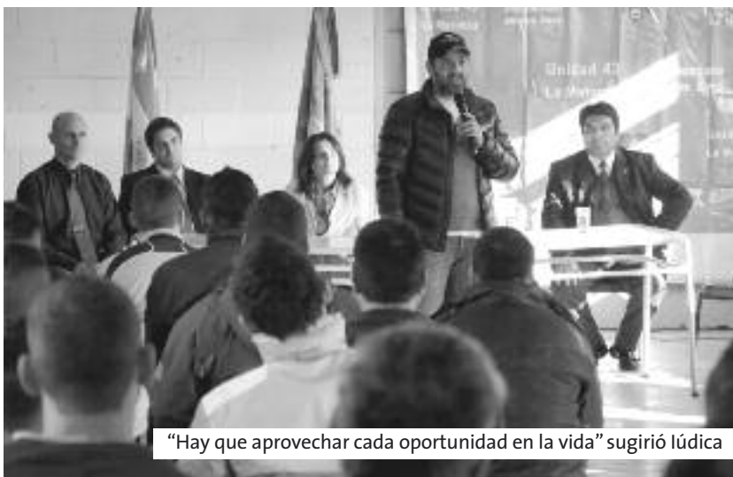
"Hay que aprovechar cada oportunidad en la vida" sugirió Lúdica