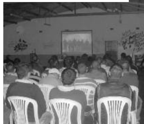
Internos disfrutaron del cine en el receso escolar

En tanto que en la tarde del jueves 25 de julio, le llegó el turno a la Unidad 39 Ituzaingó, y el 26 de julio el equipo del cine móvil se trasladó a las Unidades 10 y 34 de Melchor Romero.