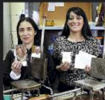
El Papa Francisco y su carta a una interna de la U. 47