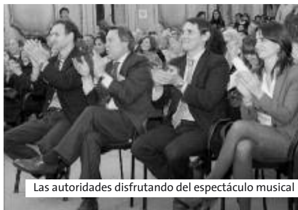
Las autoridades disfrutando del espectáculo musical