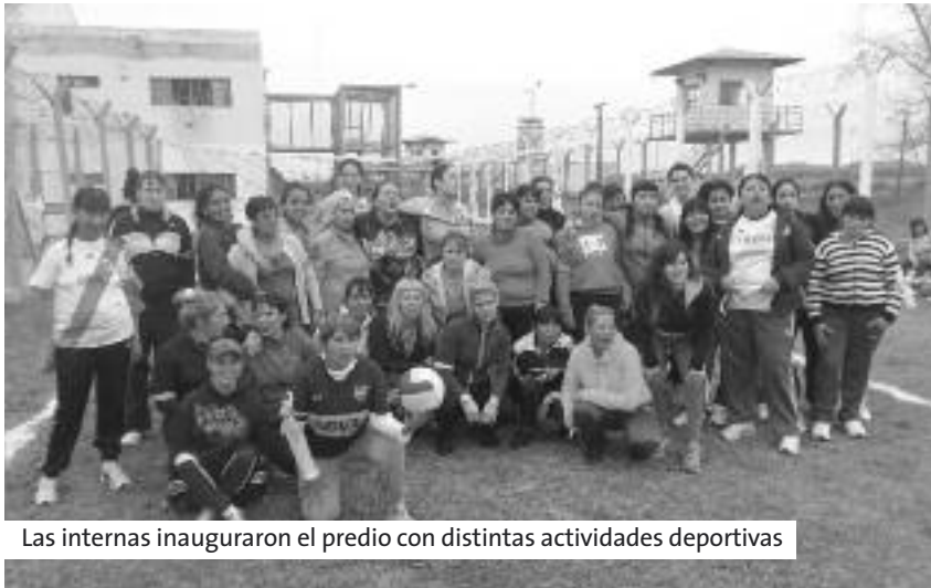
Las internas inauguraron el predio con distintas actividades deportivas