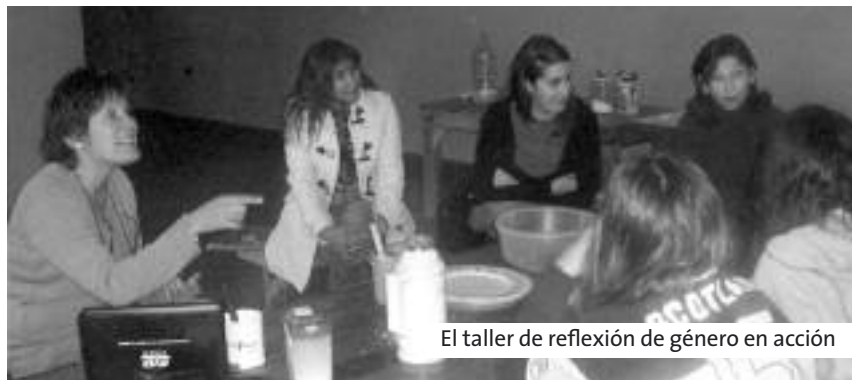
El taller de reflexión de género en acción

Por otra parte, un mes antes, se inició el taller denominado “Construyendo al ciudadano” dictado por la