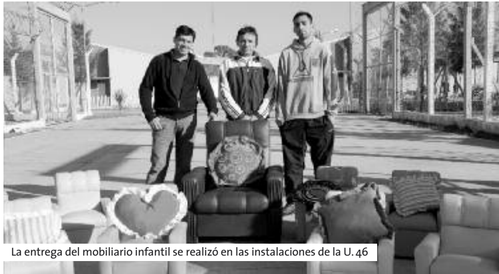
La entrega del mobiliario infantil se realizó en las instalaciones de la U. 46

Se donaron muebles para el jardín de infantes “Campanitas” y una casilla para una familia afectada por las inundaciones de La Plata. 40 internos que participan del taller de carpintería y tapicería fabrican muebles y los donan a distintas instituciones