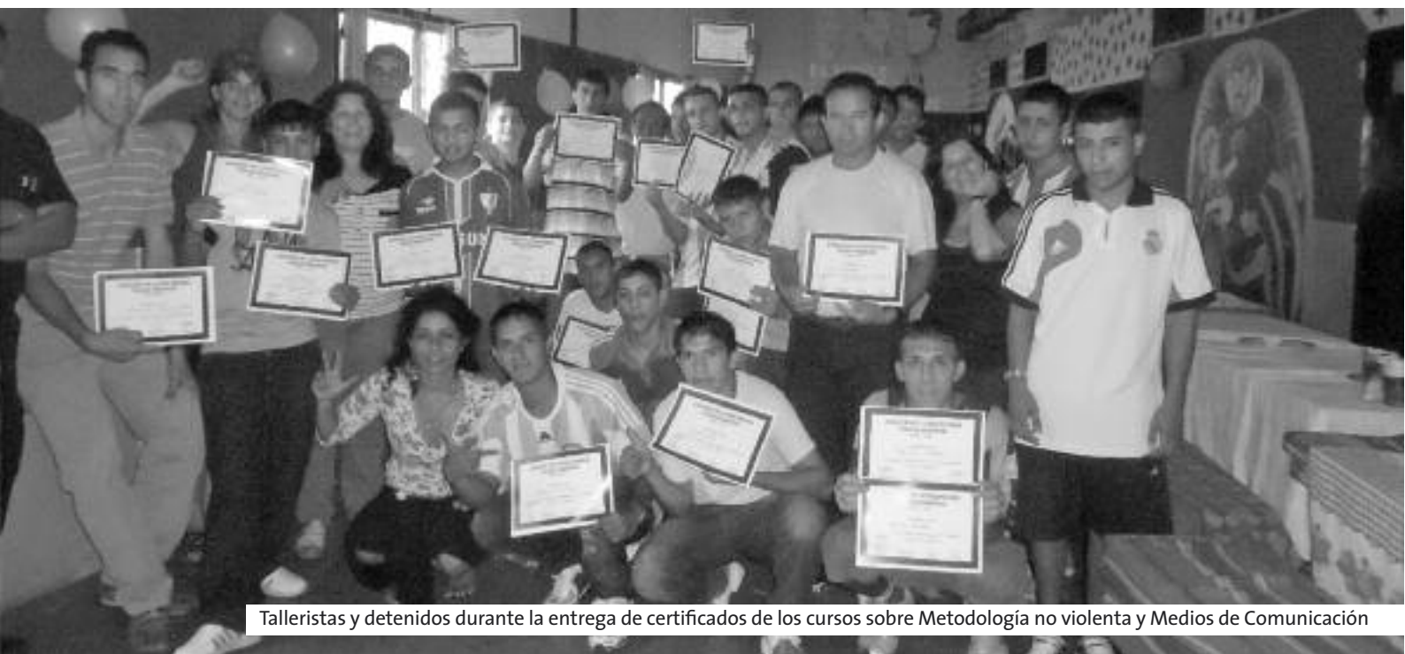
Talleristas y detenidos durante la entrega de certificados de los cursos sobre Metodología no violenta y Medios de Comunicación

Como parte del Programa Integral de Asistencia y Tratamiento para Jóvenes Adultos ( PIATJA ), promovido por la jefatura del Servicio Penitenciario Bonaerense, la Asociación Civil Activar implementa distintos talleres especiales para los internos que forman parte de este grupo.