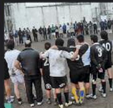
Seven de rugby en la U. 9 con jóvenes de la Villa 31