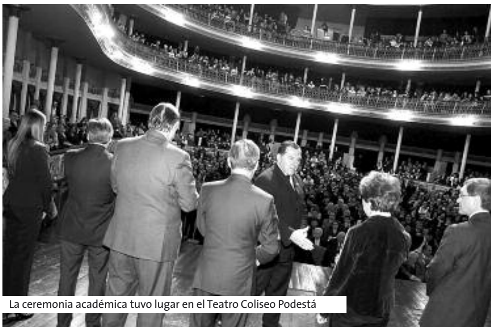
La ceremonia académica tuvo lugar en el Teatro Coliseo Podestá

Catorce agentes del servicio penitenciario de la provincia de Buenos Aires, en actividad y retirados, egresaron de la Universidad Católica de La Plata (UCALP) en un acto académico que se realizó en el Teatro Coliseo Podestá de esta ciudad