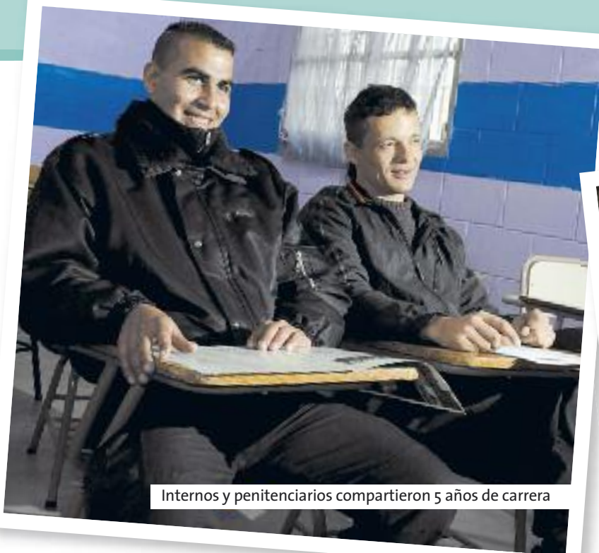
Internos y penitenciarios compartieron 5 años de carrera