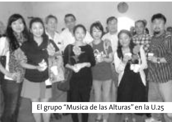
El grupo "Musica de las Alturas" en la U.25

El viernes 26 de abril, se llevó a cabo en la Unidad 25 Olmos, la presentación del grupo cristiano internacional "Música de las Alturas" para los privados de la libertad de esa dependencia carcelaria.