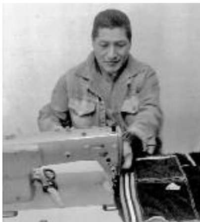
El nuevo taller cuenta con máquinas de coser y hormas para calzado

En el curso de Tapicería el objetivo es formar en el aprendizaje de las máquinas rectas, ya que su manejo es la base del oficio para poder armar las piezas. “Tenemos dos máquinas en funcionamiento y dos más que estamos reparando. Se trabaja con cuerina, goma espuma y resortes, para realizar desde un simple almohadón hasta trabajos más sofisticados como un juego de living o la reparación de asientos de automóviles. El proceso de aprendizaje va