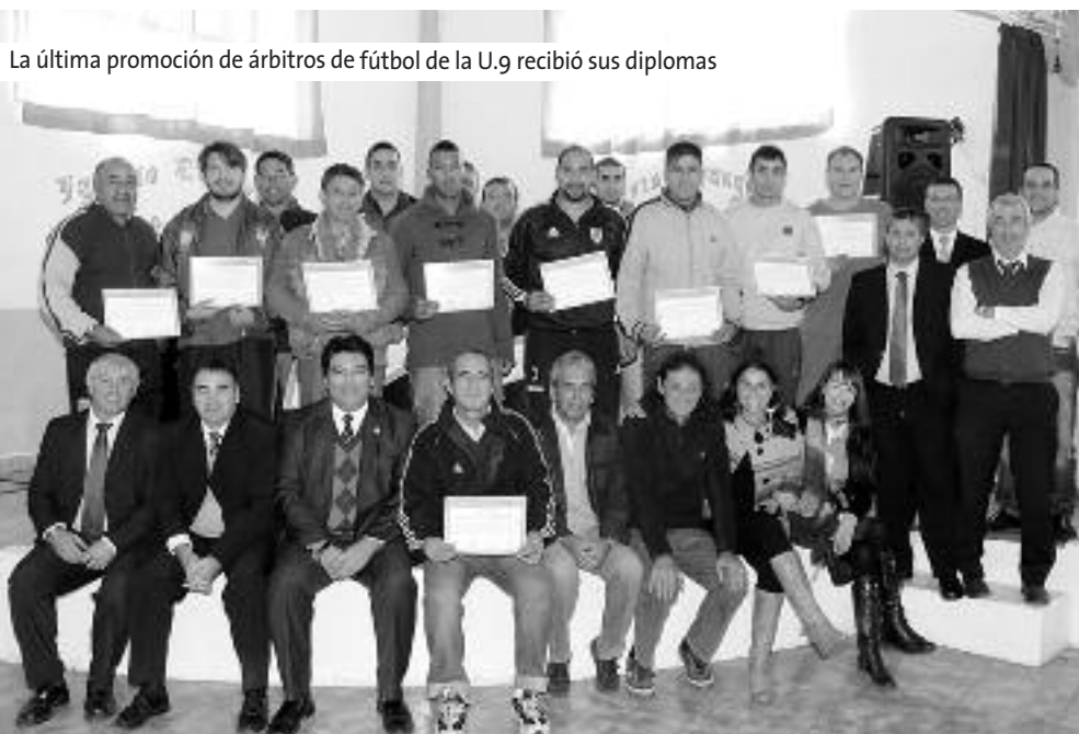
La última promoción de árbitros de fútbol de la U.9 recibió sus diplomas

Este es el tercer curso de arbitraje que se dicta en la Unidad 9, ya que empezaron en el 2011. El año pasado también participaron de la iniciativa internos de las Unidades 35 y 36 de Magdalena, y ya recibieron certificados más de 120 detenidos. “De hecho, dos de los internos que recuperaron la libertad están dirigiendo en ligas locales del interior de la provincia de Buenos Aires” , afirmó Oliveto.