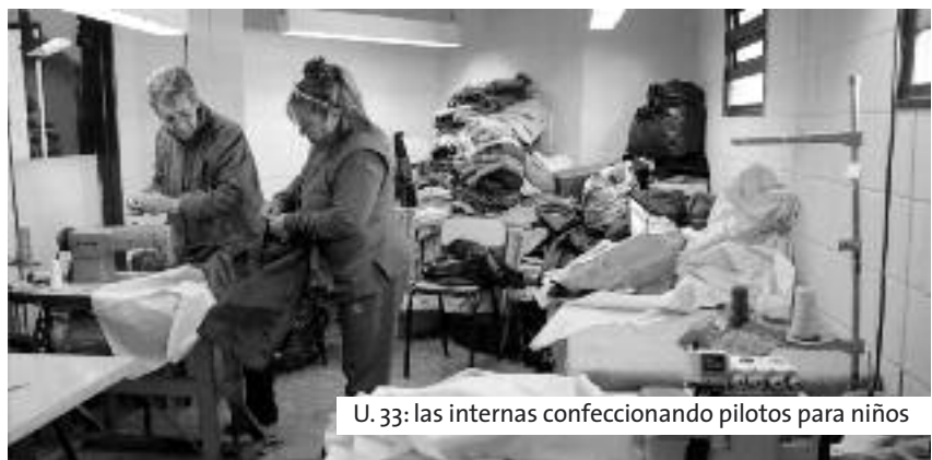
U. 33: las internas confeccionando pilotos para niños

Para este segundo semestre del año está pensado repetir el curso para otro grupo de detenidos de estas dos unidades.