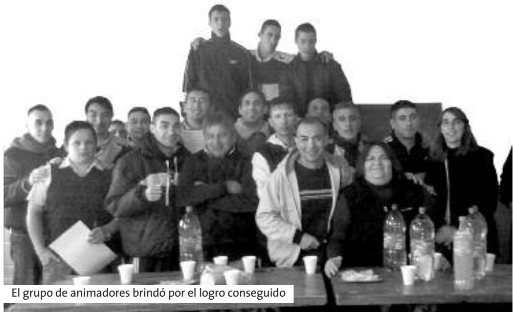
El grupo de animadores brindó por el logro conseguido

Durante la primera parte de 2013, veinte internos de la Unidad 39 Ituzzaingó se formaron como promotores de lectura de literatura. Posteriormente, los animadores realizaron prácticas con las que acreditaron sus nuevos conocimientos y recibieron certificados.