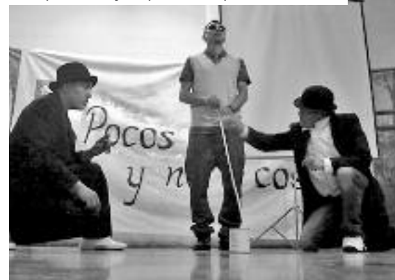
Grupo "Pocos y no poca cosa" presentó su obra

El continuo acercamiento de docentes y alumnos de la facultad al Centro Universitario Manuel Belgrano ha permitido una vez más que la interacción y el compromiso institucional cumplan el rol formador de asistir y tratar a los privados de la libertad, a través de la educación y la cultura en contextos de encierro.