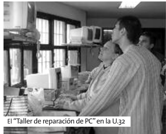
El “Taller de reparación de PC” en la U.32

Es la distribución de un sistema operativo libre, un conjunto de programas básicos y utilidades que hacen que funcione la computadora. El propósito es producir una distribución de GNU/Linux para entornos educativos y oficinas, orientada a usuarios con poca o ninguna experiencia, y mediante el desarrollo, capacitar un equipo que de soporte y asistencia a los usuarios.